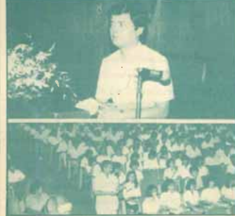
ตลาดแรงงาน ศูนย์พัฒนาและบริหารทางวิชาการ สำนักบริหารวิชาการและทดสอบประเมินผล จัดบริการทางวิชาการแก่บัณฑิต หรือไกล่เกลี่ย การศึกษา มร. น.บ.นพ. "การเตรียมตัวเข้าสู่ตลาดแรงงาน" เมื่อวันที่ 29 เมษายน 2528 ณ

* น.บ.นพ. D.S.U (Droit Constitution) D.E.A. (Droit Public), Doctem de 3 e cycle (mention Trèv bien) de Paris 2, อาจารย์ประจำคณะนิติศาสตร์ มหาวิทยาลัยรามคำแหง