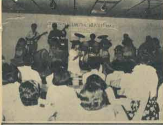
นันทนาการ อาจารย์ ม.ร. ร่วมร้องเพลงกับวงดนตรี ลูกทุ่งสุโขทัยในโอกาสครบรอบ ๑๐ ปี สภาอาจารย์ ม.ร. เมื่อวันที่ ๘ กรกฎาคม ที่สนาม ๗ สำนักงานสภากาชาด ม.ร.