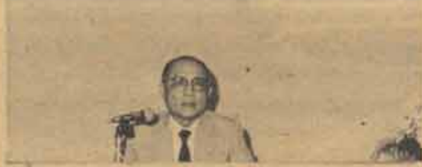
รมต.ชาญ มนุชวรรณ แสดงปาฐกถา เรื่อง "การประชาสัมพันธ์ของรัฐ"