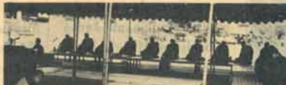
รมช.พญาอสาพร ๒๗ อภมว.ร่วมกับกลุ่มรณนุชาธรรม จัดการประชุมเพื่อระดมและผลักดันโครงการในพุทธศาสนา และมี โรงบุญมิ่งสวัสดิ ๗ บริเวณลานพุ่มฯ เมื่อวันที่ ๑ - ๒ กรกฎาคม ที่บ้านมา