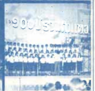
10 ปี รามคำแหง ร่วมแรงร่วมใจ สร้างสรรค์มหาวิทยาลัย เกริกไกรตลอดกาล