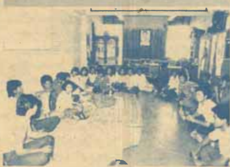
ชมรมค่ายอาสาพัฒนาธรรม-ทักษิณอุปถัมภ์งานออกค่าย

เมื่อวันที่ 16 ธันวาคม 2530 ณ ห้องที่ทำการชมรม ค่ายอาสาพัฒนาธรรม-ทักษิณ อ.ศ.ม.ร. ชั้น 3 ตึกกิจกรรม นักศึกษา ได้มีการประชุมผู้ปฏิบัติงานของชมรมฯ และ นักศึกษาอาสาสมัครออกค่ายอาสาพัฒนาชนบทที่ภาคใต้ โดยได้มีการออกไปปฏิบัติหน้าที่เมื่อเดือนพฤศจิกายน ที่ผ่านมา