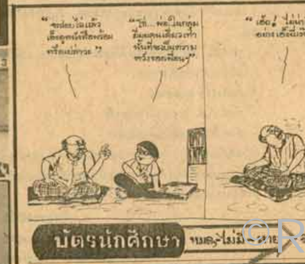
บัตรนักศึกษา ขอมุขไม่มี... (The cartoon depicts a student sitting at a desk, looking frustrated with a math problem. The text in the panels reads: 'ขอมุขไม่มี... (The student is thinking about the problem.)', '...พอมีก็ทำไม่ได้... (The student is still stuck.)', '...แล้ว... (The student is giving up.)', and '...ทำไม... (The student is questioning the problem.)')'