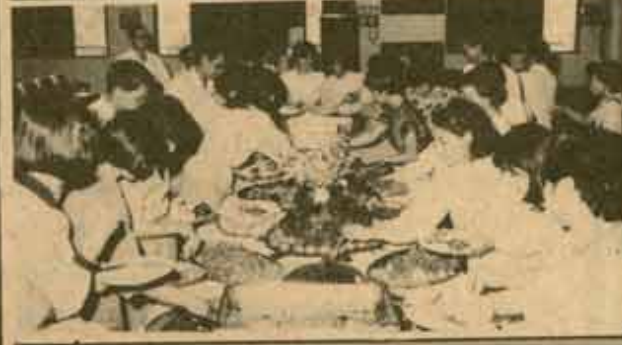
ขอมุข คณะกรรมการดำเนินการจัดงานประชุมนานาชาติ "อุดมศึกษาระบบเปิด" เนื่องขอมุขอนุกรรมการฝ่ายต่าง ๆ ที่มีส่วนช่วยเหลือให้การประชุมลุล่วงไปด้วยดี เมื่อวันที่ 30 สิงหาคม 2527 ณ ห้องประชุม คณะนิติศาสตร์ ชั้น 3