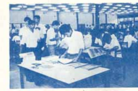
อ่านข่าวที่สนใจ