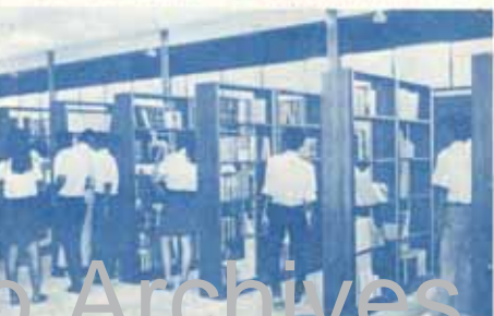
เวลาย่างเหลย ไปหาหนังสืออ่านกันเถอะ