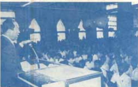
วันที่ ๒ สก. วันเปิดภาคการศึกษา งานอธิการบดี กล่าวคำต้อนรับนักศึกษาในตึกนักศึกษาศรี