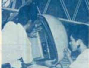
กลางแจ้งกำลังมีอุปกรณ์ในคึกคักคือเครื่องฟิวซ์ไปโดยไม้อะลูมิเนียม