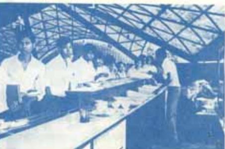
หิวข้าวเหลือเกิน เว้นพนักมาฉิวหึ่งเข้า