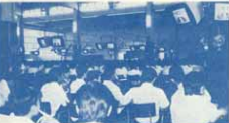
ถึงแม้จะนั่งอยู่คนละตึกกับอาจารย์ก็เห็นและได้ยิน