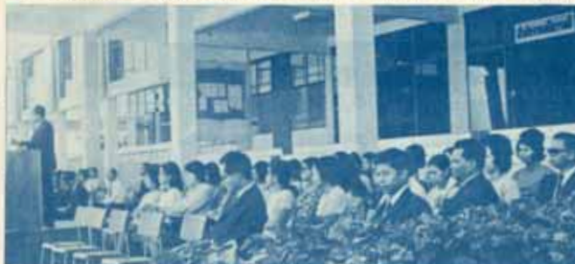
ฝ่ายอาจารย์ประจำคณะศึกษาศาสตร์