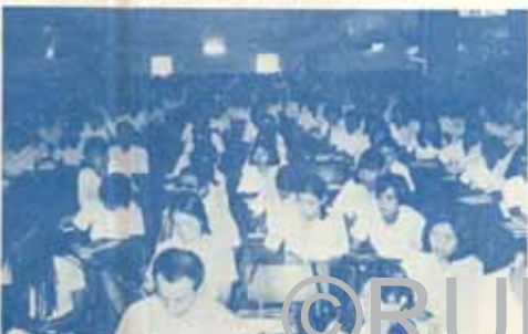
นักศึกษาตั้งใจฟังคำบรรยายจากอาจารย์