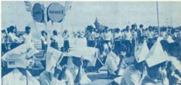
"ข่าวรามดำแดง" ก็ใช้เป็นนวมรองคอกไก่