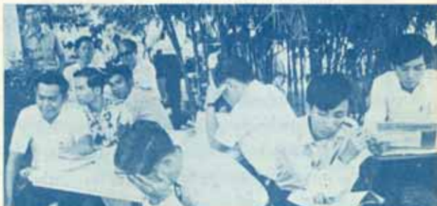
"ประท้วงระดมประท้วง เป็นใจจริงๆ"