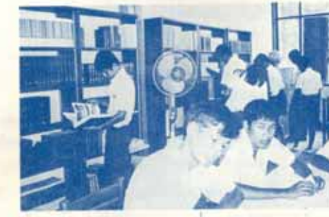
เลือกหนังสือที่ต้องการ