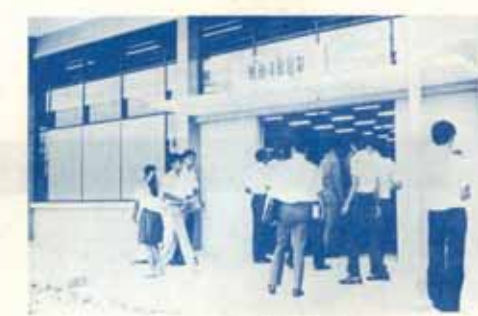
นักศึกษามากำลังเข้าไปใช้หอสมุด