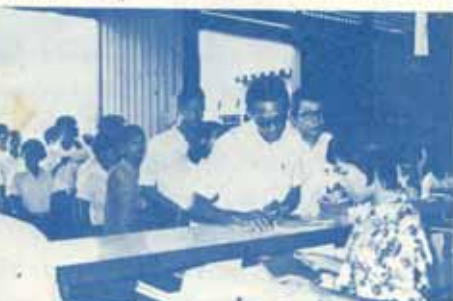
ชัชชัชคาราใหม่ๆของ ม.ร. ครับ