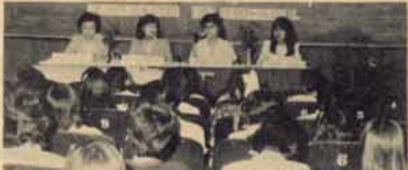
อภิปราย ชมรมบรรณารักษศาสตร์ จัดโครงการอภิปรายทางวิชาการเพื่อเพิ่มประสบการณ์แก่นักศึกษา ในหัวข้อ "แนวทางในการประกอบอาชีพของบัณฑิตบรรณารักษศาสตร์ ม.ร." และ "ปัญหาและแนวทางแก้ไขของห้องสมุดประเภทต่าง ๆ" เมื่อวันที่ 26 มกราคม 2527 ณ ห้องประชุม เอ.ดี. 2