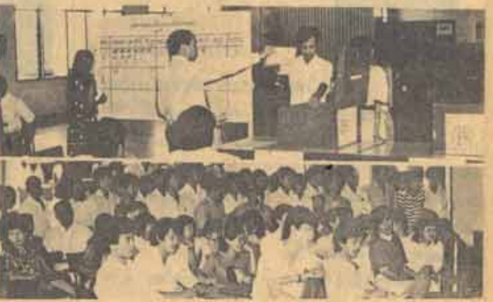
ชมรมนิสิต คณบดีนิสิตศาสตร์ ดำเนินการหยั่งเสียงเพื่อสำรวจความคิดเห็นนักเรียน

สภามหาวิทยาลัยรามคำแหง ได้มีการประชุม ครั้งที่ 3/2527 เมื่อวันที่ 28 มกราคม 2527 ณ ห้องประชุมชั้น 6 สำนักฉนวนอำนวยการ ม.ร. โดยมี ศ.ประภาสณี วยชัย นายกษัตริย์มหาวิทยาลัยเป็นประธาน ซึ่งมีเรื่องสำคัญที่น่าสนใจดังนี้ อนุมัติร่างระเบียบ ม.ร. ว่าด้วย ว่าระเบียบมหาวิทยาลัยรามคำแหง การให้อำนาจถอดถอน ม.ร. พ.ศ. 2527 สภามหาวิทยาลัยมีมติอนุมัติ