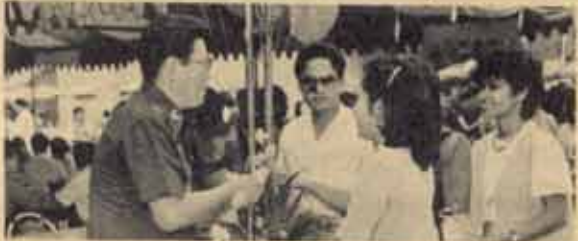
ต้อนรับชมสัมพันธ์ เมื่อวันที่ 24 มกราคม 2527 วิชา.จัดกิจกรรม และผู้แทนประชาสัมพันธ์ จาก ม.ร. ได้ไปกระเช้าดอกไม้พร้อมด้วยรางวัลและของที่ระลึกไปร่วมแสดงความยินดีกับสภามหาวิทยาลัยศรีนครินทรวิโรฒที่ศรีนครินทร์ 6 ในโอกาสครบปีที่ 27 ของตนเอง