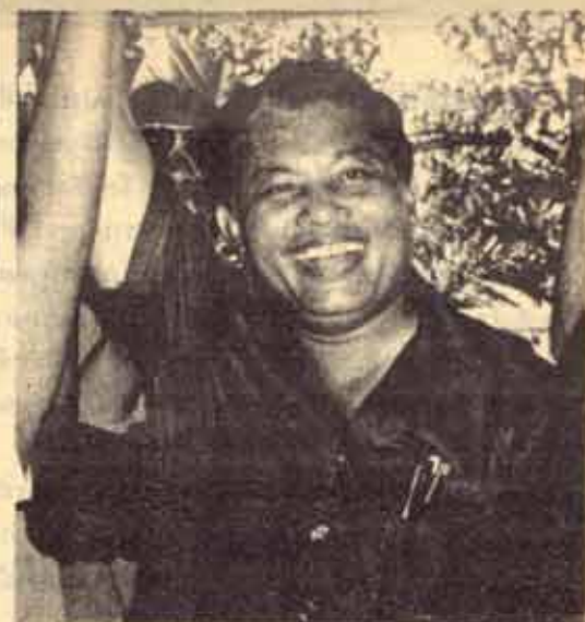
เจดีย์ ดิวังค์