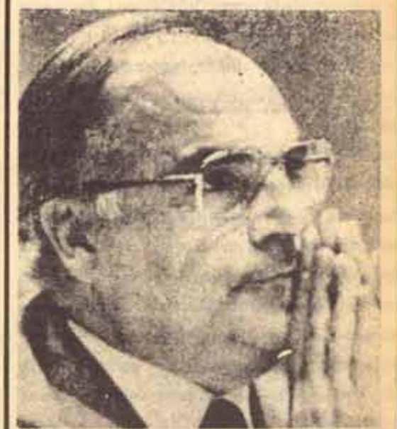
เชอมนุด โทท นายกรัฐมนตรีเยอมนันตะวันตกคนปัจจุบัน