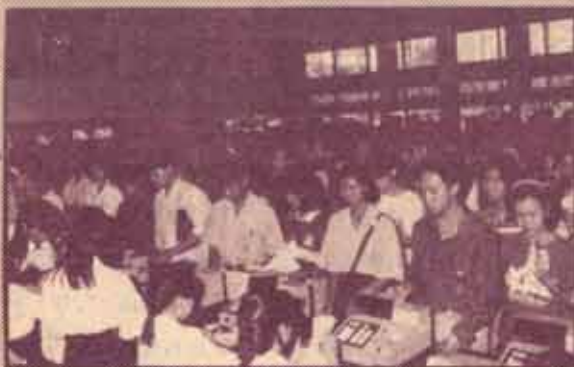
ลงทะเบียน มหาวิทยาลัยรามคำแหง ดำเนินการลงทะเบียนเรียนภาคฤดูร้อน ปีการศึกษา 2534 ระหว่างวันที่ 25-31 มีนาคม 2535 ณ รามคำแหง 1