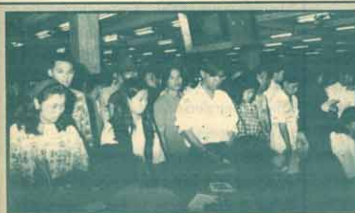
ลงทะเบียน มหาวิทยาลัยรามคำแหง กำหนดให้มีลงทะเบียนเรียนของภาค 2 ปีการศึกษา 2535 ระหว่างวันที่ 4-11 มกราคม 2536 ณ อาคารโรงโกลาสุ(KLB)

หากไม่มีเหตุการณ์สุดวิสัยใดๆ เกิดขึ้นแล้ว คาดว่าสภาพเศรษฐกิจในปีหน้า จะเติบโตได้ดีกว่าปีนี้อย่างแน่นอน และจะส่งผลไปถึงปี 2537 ด้วย แต่ทั้งนี้รัฐบาลและเอกชนจะต้องร่วมมือกันในการแก้ไขปัญหาต่างๆ เช่น ด้านการกีดกันการค้า หรือการรวมกลุ่มการค้า ให้สำเร็จไปได้อย่างดีด้วย