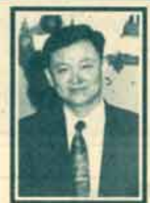
พ.ต.ท. ดร.ทักษิณ ชินวัตร