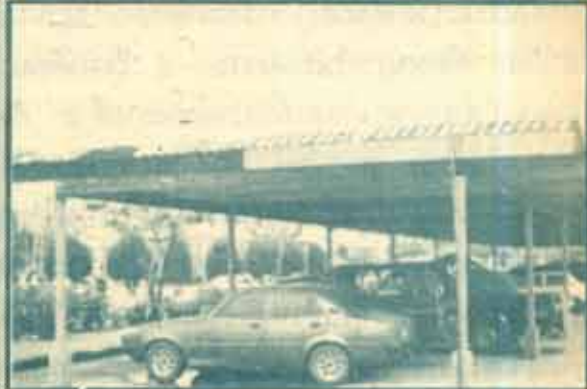
ผู้สหายดา... มหาวิทยาลัยรามคำแหงได้ดำเนินการจัดทาสีโรงรถของทุกคณะ/สำนักให้เป็นแนวเดียวกันโดยใช้สีน้ำเงิน-ทองเหมือนกันทุกแห่งเพื่อความสะอาดและเป็นระเบียบเรียบร้อยแก่ผู้พบเห็น