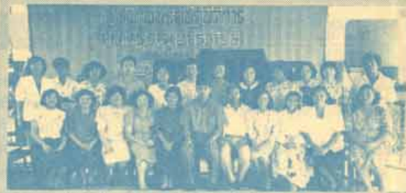
การผลิตสื่อเพื่อส่งเสริมการอ่านและการสอน คณะวิทยากรจากสำนักหอสมุดกลาง มหาวิทยาลัยรามคำแหง ร่วมมือกับนักศึกษารวมถึงผู้บริหารมหาวิทยาลัย ในการผลิตสื่อเพื่อส่งเสริมการอ่านและการสอนแก่ครูโรงเรียนมัธยมศึกษา เขตการศึกษา 7 (จังหวัดพิษณุโลก) และเขตการศึกษา 6 (จังหวัดพญา) ระหว่างวันที่ 26 มกราคม - 2 กุมภาพันธ์ ที่ผ่านม