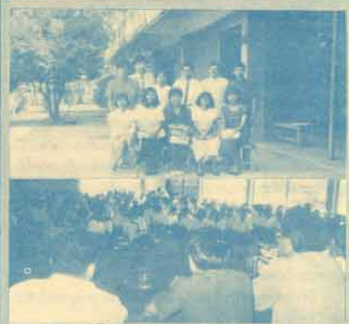
ชมรมศึกษาค้นคว้าร่วมศึกษาคณะ จันทบุรี จัดคณะแนวทางการศึกษา ชมรมศึกษาค้นคว้าร่วมศึกษาคณะ จันทบุรี ร่วมกับโรงเรียนเบญจมราชูทิศ จังหวัดจันทบุรี จัดแนะแนวการศึกษาแก่นักเรียนของโรงเรียนฯ เมื่อวันที่ 4 กุมภาพันธ์ 2531 โดยเชิญวิทยากรแนะแนวจากศูนย์บริการทฤษฎีวิชาการและสหภาพ สังกัดวิทยาลัยการและการเกษตรของประจักษ์ผล มหาวิทยาลัยรามคำแหง ไปให้ข้อมูลต่าง ๆ เกี่ยวกับการศึกษาต่อในมหาวิทยาลัยรามคำแหง มีนักเขียนเจ้าพนักงาน และ นาวาตรี (๒๖) ฯลฯ

จากตัวอย่างการสร้างฐานข้อมูลบุคลากร ในการนำข้อมูลเข้าสู่ระบบจะต้องกำหนดลักษณะโครงสร้างของฐานข้อมูล ส่วนที่จะใช้ในการสืบค้นและรูปแบบการแสดงผล ซึ่งรูปแบบการแสดงผลอาจมีหลายรูปแบบก็ได้ตามความต้องการจากรูป 1 เป็นรูปแบบการนำข้อมูลบุคลากรเข้าสู่ระบบ ซึ่งต้องคำนึงถึงข้อมูลที่จะนำเข้ามาและส่วนที่ต้องการแสดงผล ว่าจะตามต้องการหรือไม่ และเมื่อข้อมูลเข้าสู่ระบบจะสร้างข้อมูลสืบค้นให้ตามที่กำหนดไว้ เมื่อต้องการสืบค้น เช่น ต้องการหาข้อมูลบุคลากรที่เลือกเมนูในการสืบค้นเดียวกันชื่อ เช่น สมศักดิ์ เครื่องจะค้นหาคนที่ชื่อสมศักดิ์ทุกคนที่มีในระบบ และจะแสดงประวัติของแต่ละคน แต่ถ้าต้องการค้นหา นายสมศักดิ์