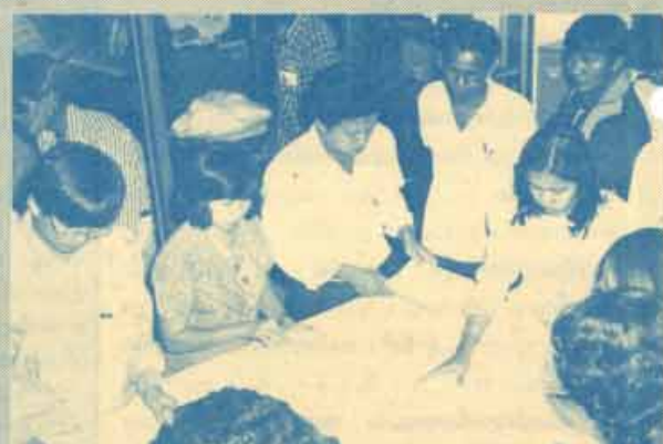
นักคะแนนด้วยเครื่องคอมพิวเตอร์ เมื่อวันที่พฤหัสบดีที่ 11 กุมภาพันธ์ 2531 ตั้งแต่เวลา 17.00 น. เป็นต้นไป ณ สถาบันบริการคอมพิวเตอร์ ที่สำนักงานบริหารทางวิชาการและทดสอบประเมินผล (สร.บ. ชั้น 4) มหาวิทยาลัยรามคำแหง ได้ดำเนินการนับคะแนนด้วยเครื่องคอมพิวเตอร์ เพื่อทราบผลการเลือกตั้งคณะกรรมการองค์การนักศึกษา และสมาชิกสภานักศึกษา ประจำปีการศึกษา 2531 ซึ่งนับคะแนนแล้วเสร็จเมื่อเวลา 20.30 น.ปรากฏว่าพรรคอภิปัตย์ ได้รับเลือกตั้งเป็นองค์การนักศึกษาชุดใหม่ ด้วยคะแนนไว้รวมใจจากนักศึกษาจำนวน 2,379 เสียง

21, 30, 31 และ 32 “ข่าวรามคำแหง” ในฐานะที่เป็นสื่อการประชาสัมพันธ์ของมหาวิทยาลัยรามคำแหง รู้สึกปิติยินดีเป็นอย่างยิ่ง ที่ชาวรามคำแหงทั้ง 14 คน มีความสามารถในการสอบผ่านได้รับการบรรจุเป็นข้าราชการของกระทรวงการต่างประเทศ หวัง