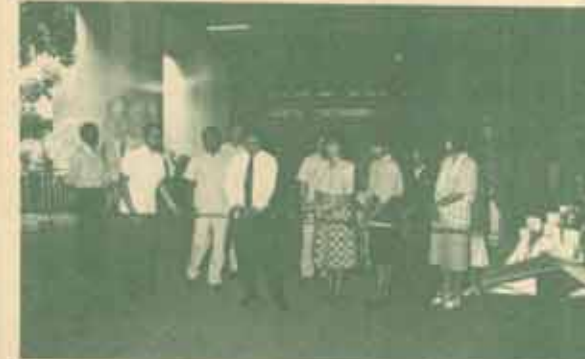
นักพบแรงงาน รท. สุขุม นวลสกุล อธิการบดี มหาวิทยาลัยรามคำแหงเป็นประธานเปิดงาน "วันนักพบแรงงาน" ซึ่งรวมแนะแนวและทุนการศึกษา กองกิจการนักศึกษา ม.ร. ร่วมกับ บริษัทและหน่วยงานต่าง ๆ จัดขึ้นเมื่อวันที่ 27 - 28 มกราคม 2530 ณ อาคารศิลาอาสน์