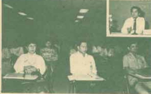
ฝึกอบรม คณะกรรมการดำเนินการพัฒนาและฝึกอบรมบุคลากร ม.ร. จัดการฝึกอบรมหลักสูตร "การบริหารงานบุคคล รุ่นที่ 2" เมื่อวันที่ 26 - 30 มกราคม 2530 ณ ห้องประชุม ประมวล กุลมณี โดยมามีผู้ปฏิบัติงานเกี่ยวกับงานบุคคลจากหน่วยงานต่าง ๆ เข้าร่วมการอบรม จำนวน 40 คน