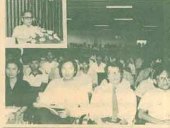
อภิปราย คณะนิติศาสตร์ ม.ร. จัดการอภิปรายทางวิชาการเรื่อง "อาชญากรรมทางเศรษฐกิจ : อุปสรรคและข้อเสนอเกี่ยวกับประสิทธิภาพของการบังคับใช้กฎหมาย" โดย พล.อ. สิทธิ จีโรจน์ อธิการบดีมหาวิทยาลัยรามคำแหง เมื่อวันที่ 27 มกราคม 2530 ณ ห้องประชุมคณะนิติศาสตร์ ชั้น 8