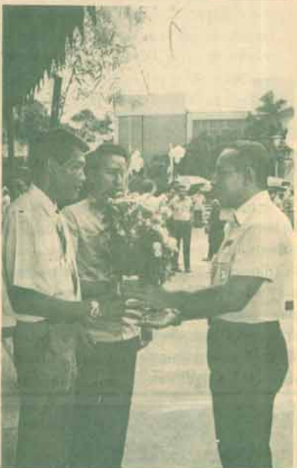
30 ปีของ 5 เมษายน บุญซึ้ง หัวใจแห่งประชาสัมพันธ์ ม.ร. ร่วมแสดงความยินดีในโอกาสจากปีที่ 30 ของสถาบันราชภัฏธนบุรี เมื่อวันที่ 29 มกราคม 2530