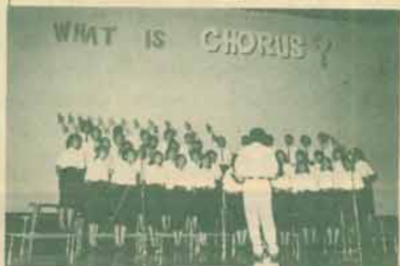
ประสานเสียง ชมรมขับร้องประสานเสียง ม.ร. จัดการแสดงขับร้องประสานเสียงแก่นักศึกษา เมื่อวันที่ 28 มกราคม 2530 ณ หอประชุม 10.ค. 1