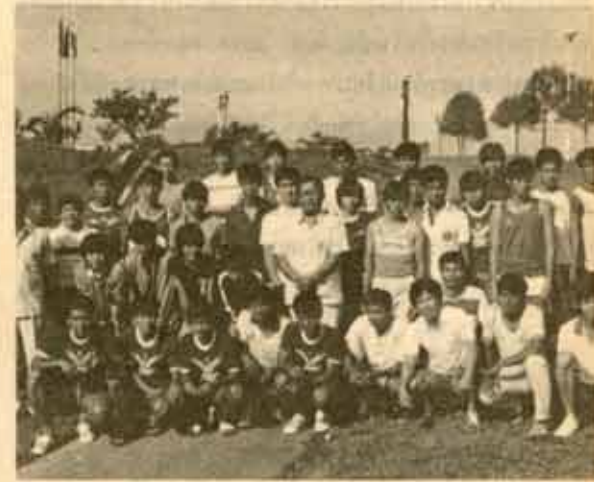
7. ทีมนักกีฬาลูกพี่ลูกน้อง และคณะผู้แทน ม.ร.