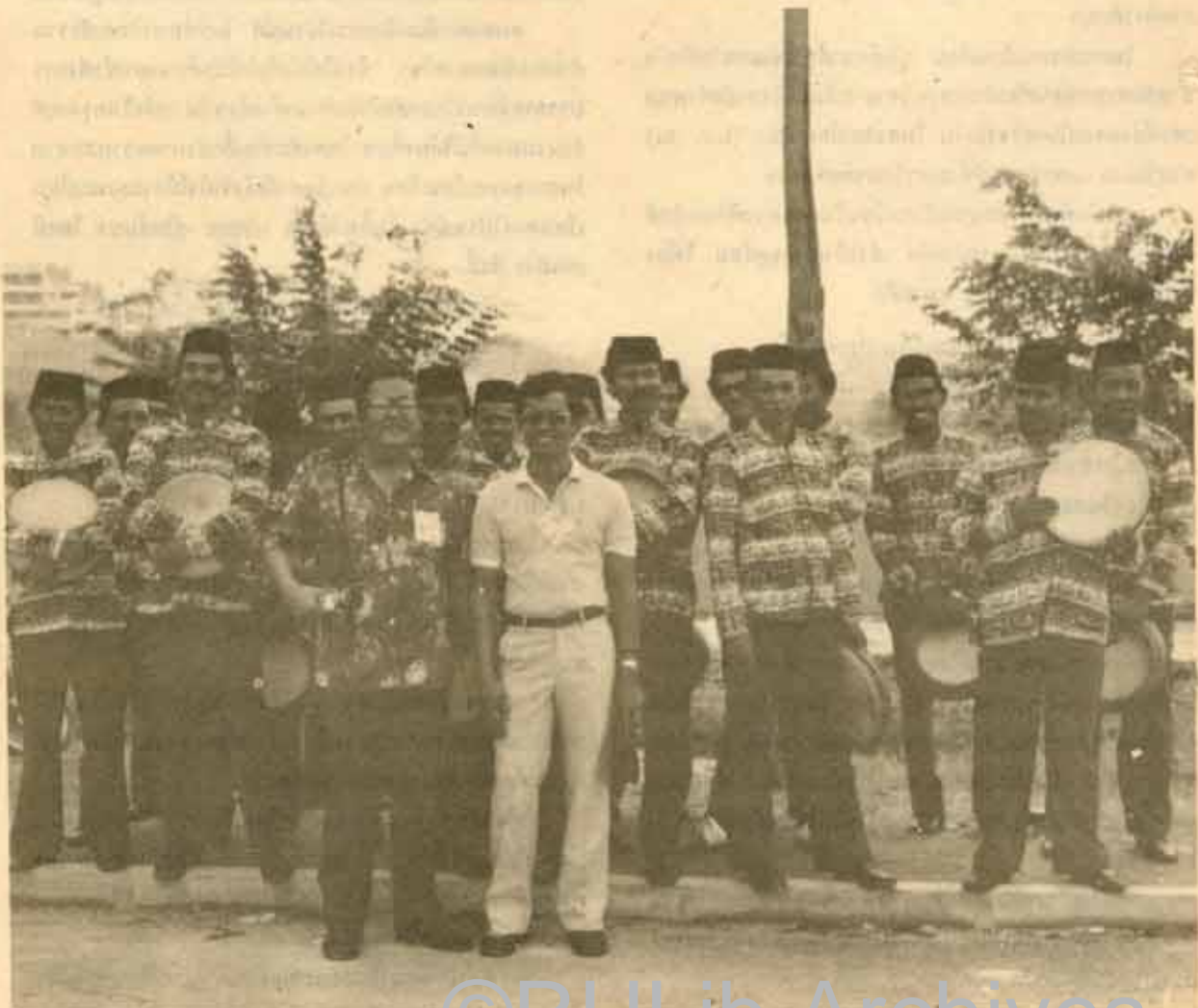
5. นัโห้คู่ศวันรับประธานเปิดการแข่งขันกีฬามหาวิทยาลัยอาเซียน