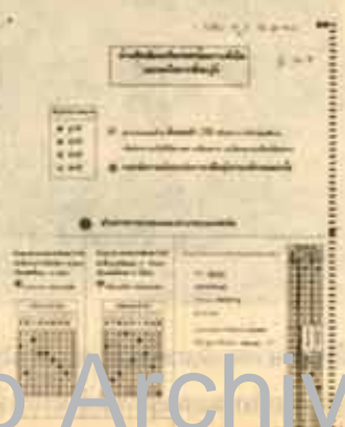
ด้านหลัง