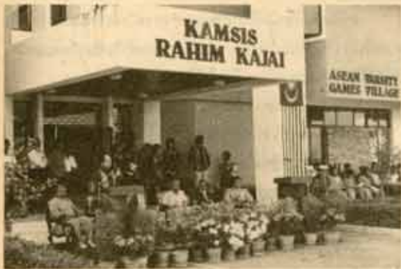
2. พิธีเปิดหมู่บ้านนักกีฬาโดยรองอธิการบดีฝ่ายกิจการนักศึกษา