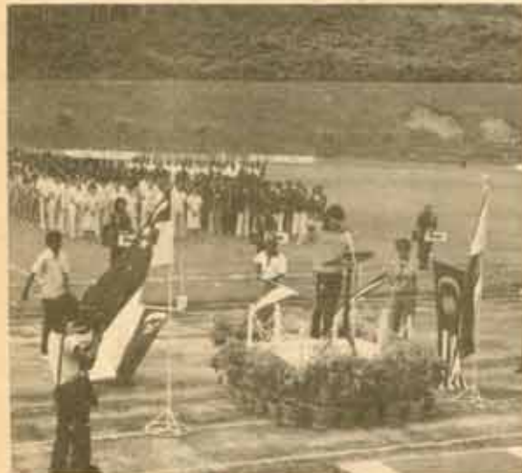
4. พิธีเปิดการแข่งขันกีฬามหาวิทยาลัยอาเซียนครั้งที่ 3 นักกีฬาทำถวัลย์กล่าวปฏิญาณและมีการแข่งขันฟุตบอลคู่เกิดสนามระหว่างไทยกับมาเลเซีย (มธไทยชนะ 1 0)