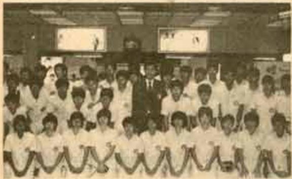
1. ทีมนักกีฬาไทย ก่อนออกเดินทางจากสนามบิน

สำหรับสถานที่แข่งขันและที่พักนั้น ใช้สนามของมหาวิทยาลัย KEBANGSAAN เป็นหลัก นอกนั้นกระจายไปตามสนามมหาวิทยาลัยอื่น ๆ เนื่องจากสนามแข่งขันกระจัดกระจายไปทำให้ นักกีฬาและกองเชียร์ต้องใช้เวลาในการเดิน