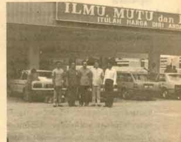
10. คณะกรรมการจาก ม.ร. อธิการบดีและกรรมการฝ่ายกิจการนักศึกษา