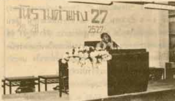
100 ปีการศึกษาเพื่อปวงชน ศ.ดร.ก่อ สวัสดิ์พาณิชย์ แสดงปาฐกถาพิเศษเรื่อง "100 ปีการศึกษาเพื่อปวงชน" ในงาน "วันรามคำแหง 27" เมื่อวันที่ 26 พฤศจิกายน 2527 ณ อาคารศิลาอาสน์ 201