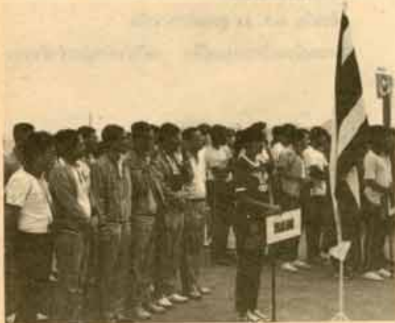
3. ตัวแทนเจ้าหน้าที่และนักกีฬาไทยร่วมพิธีเปิดหมู่บ้านนักกีฬา