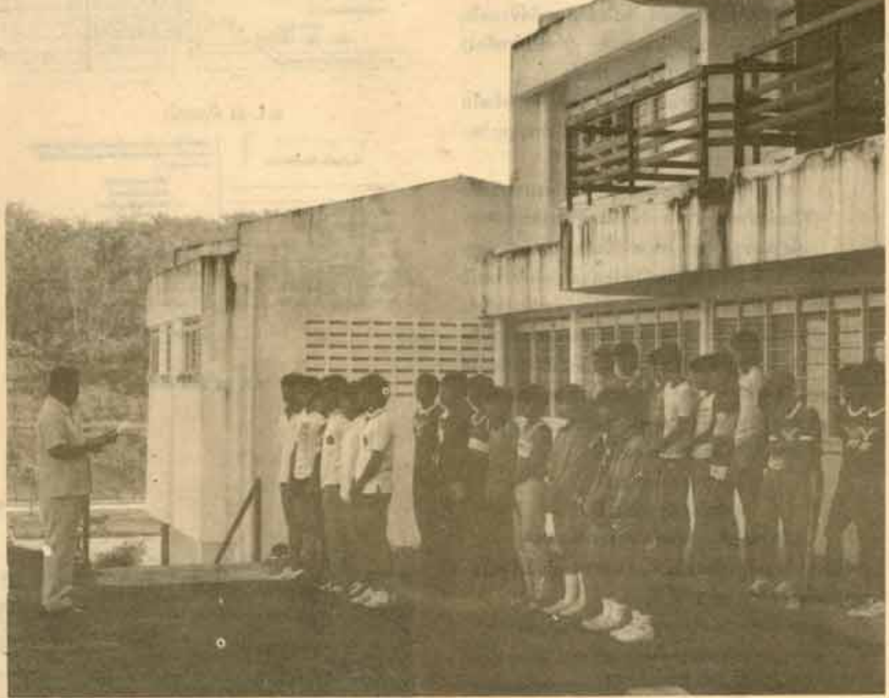
5. พศ.ดร.กิตติ จงวัฒนาภรณ์ รองอธิการบดีฝ่ายกิจการนักศึกษา อำนวยการดำเนินงานกีฬา ม.ร. และมอบเหรียญพี่ๆ เป็นกำลังใจแก่นักกีฬาจากพี่ๆ