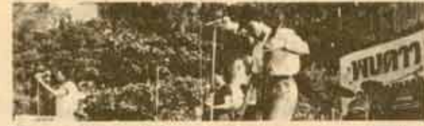
คณะคณะกรรมการประชาสัมพันธ์ ม.ร. จัดรายการดนตรีเนื่องในวันสถาปนา ม.ร.ครบรอบ 13 ปี (วันที่ 26 พฤศจิกายน 2527) ณ เวทีลาน สวป. รามฯ 1 เป็นการแสดงจาก วง "ซิกแซกซ์" และ "ฟรุ๊ตตี้" โดยความร่วมมือจาก บริษัท อารี.เอส.ซาวด์ และคาตา ซาวด์

จะกลับบ้านวันของบ วันดาไกลมาถึง คิดแล้วจึงนำดาไหล บุญคุณครูอยู่เหนือใคร จะจำไว้จนวายวาง แห่งมองคู่อองฟ้า ก็รู้ว่าฟ้าสว่าง เคยมีคิดเดินคิดทาง อาจารย์สร้าง...ให้ทางเดิน ความรู้อยู่กับกาย ทุกข์ทั้งหลายก็ห่างเกิน ถึงหลอดดวงที่ดวงเกิน ก็เผชิญอย่างมั่นใจ จะกลับบ้านวันพุงนี้ เพื่อบอกพี่ที่เวือนไซ "เป็นนายให้ชาวไทย ที่ไม่ใช่เป็น...นายทุน"