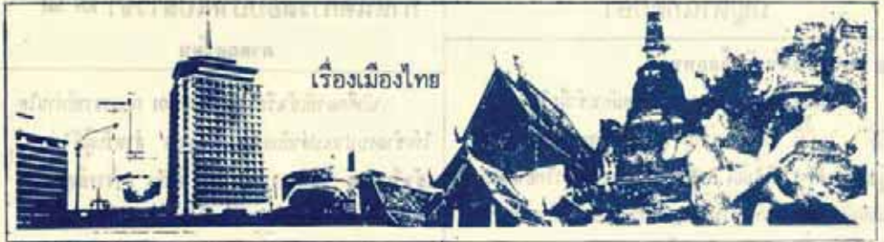
เรื่องเมืองไทย

หมายเหตุ จากข้อเขียนนี้ไม่ได้หมายความว่า การศึกษานี้หาความรู้ดีกว่ากันที่ปริญญาหรือเกียรตินิยม ผู้เขียนเองก็เห็นด้วยกับที่ว่า ค่าความรู้ขึ้นอยู่กับที่การนำความรู้ที่ได้รับไปใช้อย่างสุจริตและได้ผลเป็นอย่างไรในการปฏิบัติงาน