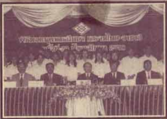
มอบทุนการศึกษา บริษัทกระเจงไทย-อาซาฮี จำกัด จัดพิธีมอบทุนการศึกษาแก่นิสิต นักศึกษา มหาวิทยาลัยต่าง ๆ เมื่อวันที่ 13 กันยายน 2539 ณ ห้องเพลินจิต โรงแรมอิมพีเรียล ในโอกาสนี้มีนักศึกษามหาวิทยาลัยรามคำแหงได้รับทุนดังกล่าว จำนวน 2 ราย

หรือตามโอกาสแห่งขนบธรรมเนียมประเพณี ซึ่งเรื่องนี้อยู่ในความเป็นห่วงของคณะรัฐมนตรีถึงกับมีการหารือกันและฝากเรื่องไปยังกรมสรรพากรเพื่อพิจารณาสรุปว่า สมรภัษ คำสิงห์ ได้รับยกเว้นภาษีเงินได้อย่างแน่นอนในเงินรางวัลที่ได้รับ แต่จะยกเว้นมากหรือน้อยนั้นคงขึ้นอยู่กับความเมตตาและความหนักอกหนักใจของกรมสรรพากร.....ถ้าตีความไม่ดี.....หัวขบวนอาจถูกเนื้อม.....รับรองว่างานนี้ไม่มีแพะแทน