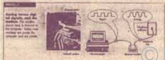
การเปลี่ยนดิจิทัลเป็นอนาลอก

ดังนั้น การใช้หลัก Nobody Lose จึงช่วยกระตุ้นให้คนเราไม่ทำตนตามอารมณ์ ในขณะที่อยู่ในสถานการณ์ของการที่จะต่อรอง การตัดสินใจข้อขัดแย้งระหว่างคนและผู้อื่น รวมทั้งในสถานการณ์ของการคบหาสมาคม การทำงานร่วมกัน และการใช้ชีวิตในครัวที่ครอบครัวอยู่ด้วยกัน เพื่อจะได้คบหา ร่วมกันทำงาน และอยู่ร่วมครัวเดียวกันตลอดไป ไม่ต้องมานั่งเสียความรู้สึกในครัวที่ต้องเถิกคกกันหรือต้องแยกทางกันเดิน