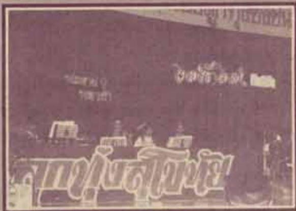
ประกวดเพลง ชมรมลูกทุ่งสุโขทัย จัดประกวดนักเรียนลูกทุ่งชิงชนะเลิศ ณ อาคารหอประชุม เอ. ที. 1 เมื่อเร็ว ๆ นี้