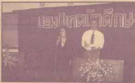
รองอธิการบดีฝ่ายวิทยาเขตกล่าวต้อนรับ ในฐานะเจ้าของบ้าน