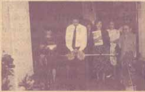
อธิการบดีเปิดนิทรรศการแนะนำรามฯ 2