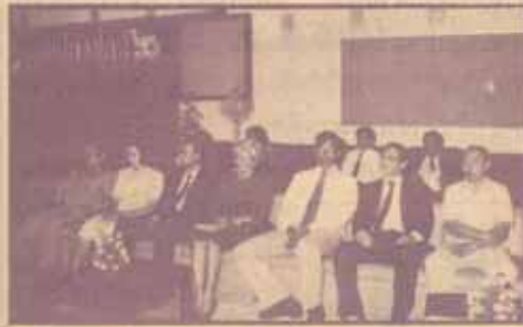
คณาจารย์-ผู้บริหาร ม.ร. ร่วมต้อนรับนักศึกษาใหม่