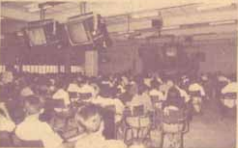
นักศึกษาฟังการประชุมนิเทศอย่างตั้งอกตั้งใจ