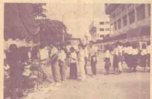
นักศึกษารับเอกสาร