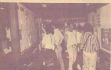
ชมนิทรรศการ