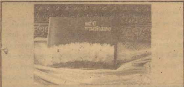
คณะกรรมการจัดพิมพ์หนังสือระลึก "15 ปี รามคำแหง" ได้พิมพ์หนังสือเสร็จแล้ว เป็นหนังสือขนาด 8 หน้ายก ปกแข็ง เดิมทอง มีปกหุ้ม ออบพลาสติก พิมพ์ 4 สี ข้อด้วยตนเองเล่มละ 100 บาท (ที่ สวป.ชั้น 7) ส่งช่องทางไปรษณีย์ ส่งตัวแลกเงินหรือธนาณัติ 120 บาท (ส่งจ่าย ปรณ.รามคำแหง ในนามคุณหัตถา ชาตวัฒน์ศิริ สวป.มหาวิทยาลัย รามคำแหง 10240)

EC 10 3 EC 112 EC 211 EC 212 EC 213 EC 214 EC 30 1 EC 30 4 EC 312 EC 314 EC 318 EC 326 EC 342 EC 343 EC 346 EC 354 EC 358 EC 359 EC 366 EC 367 EC 368 EC 371 EC 382 EC 383 EC 384 EC 385 EC 387 EC 414 EC 414 EC 416 EC 427 EC 473 EC 475 EC 482 EC 486 EC 489 EC 392 EC 216 EC 325 EC 443 EC 351 EC 383 EC 462 EC 488 EC 356 EC 454 EC 464 EC 369 EC 472