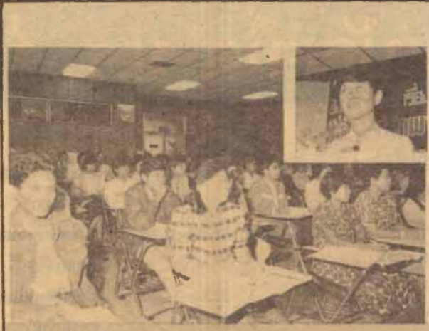
กิจกรรม คิว.ซี. คณะกรรมการดำเนินการพัฒนาและฝึกอบรมบุคลากรของ ม.ร. จัดการเสนอผลงานกลุ่มกิจกรรม คิว.ซี. ของหน่วยงานต่าง ๆ ในมหาวิทยาลัย เมื่อวันที่ 17 - 18 พฤศจิกายน 2529 ณ ห้องประชุมประมวล กุลมาตย์