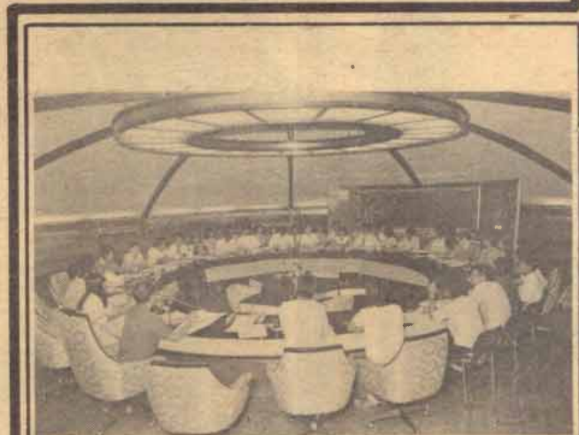
กก.บัณฑิต คณะกรรมการบัณฑิต รุ่นที่ 12 ซึ่งเป็นผู้แทนจากทุกคณะ คณะละ 5 คน ได้ประชุมครั้งแรกเมื่อวันที่ 21 พฤศจิกายน 2529 ณ ห้องประชุมใต้พระรูปพ่อขุนฯ เพื่อหารือเกี่ยวกับ การดำเนินงาน ของคณะกรรมการบัณฑิตในภา มหิ ราช วิทยาลัย รังสิต