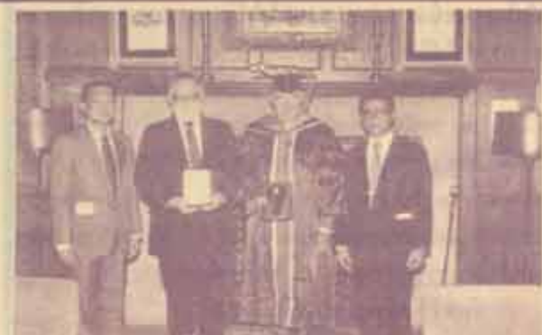
การปกครองของประเทศเอเชียร่วมกับ ม.ร.

ด้วยคณะศึกษาศาสตร์, คณะบริหารธุรกิจและคณะวิทยาศาสตร์ มีความจำเป็นต้องขอเปลี่ยนแปลง วัน เวลา และห้องเรียนของบางกระบวนวิชาที่เปิดสอนใน ภาค 1/2529 มหาวิทยาลัยจึงให้เปลี่ยนแปลง วัน เวลา และห้องเรียนของบางกระบวนวิชา จากที่ได้ประกาศไว้เดิมใน น.ร. 30 เป็นดังนี้