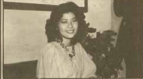
ปานเลขา ในวาระที่กร่วมงานวันสถาปนาคณะมนุษยศาสตร์