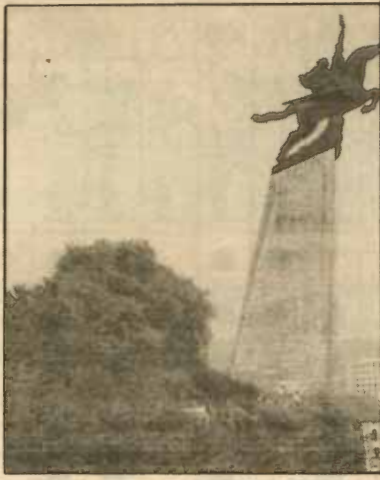
อนุสาวรีย์นัมบิน สัญลักษณ์ของการพัฒนาเศรษฐกิจแบบก้าวกระโดด