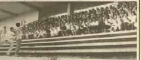
ซ้อมเชียร์ ชมรมเชียร์ มหาวิทยาลัยรวมค่านาง จัดฝึกซ้อมการเชียร์แก่นักศึกษา เพื่อเป็นกองเชียร์ของ ม.ร. ในการแข่งขันกีฬามหาวิทยาลัยฯ ครั้งที่ 18 โดยฝึกซ้อมครั้งแรก เมื่อวันที่ 7-9 ตุลาคม ที่สนามกีฬา ณ สนามกีฬามหาวิทยาลัย และกำหนดฝึกซ้อมครั้งต่อไปในวันที่ 26, 27 และ 29 ตุลาคม 2528