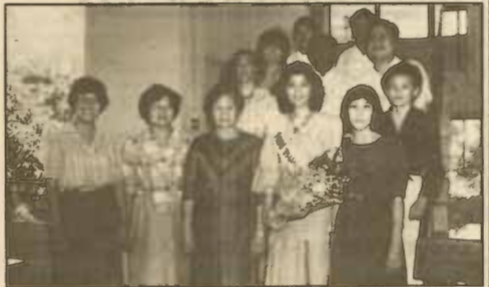
ถ่ายรูปรูปร่วมกับอาจารย์ภาควิชาภาษาอังกฤษและคณะมนุษยศาสตร์

คงยังจำกันได้ว่า เมื่อเดือนกันยายนที่ผ่านมา มีการจัดประกวด Miss Thailand World ขึ้นเป็นครั้งแรกในประเทศไทย เพื่อคัดเลือกเป็นตัวแทนของประเทศไทยไปประกวดนางงามโลก หรือ Miss World ที่ประเทศอังกฤษในเดือนพฤศจิกายนนี้