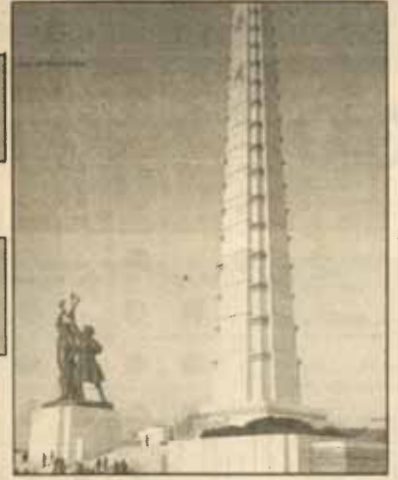
ภาพทอกลอยจู่ Juche Tower