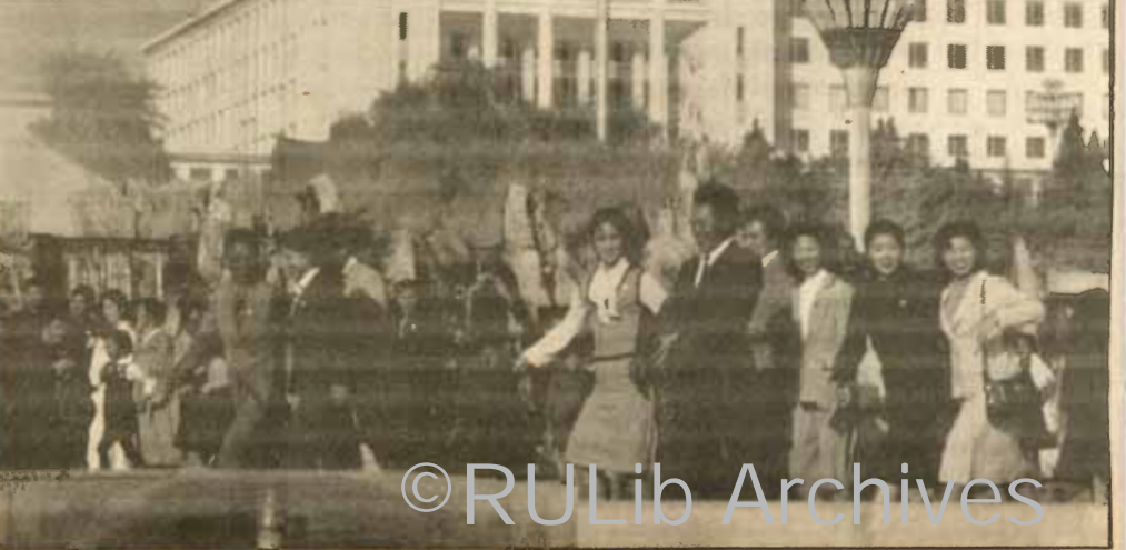
ภาพชีวิตประจำวันชาวเกาหลีระหว่างเดินทางไปทำงาน

สถานทูตอื่นคอยต้อนรับอยู่ และเลี้ยงข้าวปลอบขวัญพวกเรา 1 มื้อ ต้องขอขอบพระคุณทุกท่านไว้ ณ โอกาสนี้ด้วย และที่พวกเราคาดไม่ถึงก็คือ ได้อนุญาตให้คณะของเราค้างที่สถานทูตได้ ไม่ต้องไปหาโรงแรม (หากไม่ได้) ไม่ต้องหาข้าวเย็นกิน (ถ้ากินสามทุ่มร้านปิดหมดก็ไม่มีที่กิน) พวกเราจึงโชคดีกับผืนแผ่นดินไทย (สถานทูตตามกฎหมายระหว่างประเทศก็ถือเสมือนว่าเป็นดินแดนของประเทศนั้น ๆ) พวกเราอนหลับฝันดี และเริ่มมีอาการโสมซิกขึ้นต้นกันคนละเล็กน้อย ว่าอนาคตของเราจะโชติช่วงชัชวาลย์หรือไม่ เพราะต้องขึ้นรถลงเรือกันอีกหลายเที่ยว