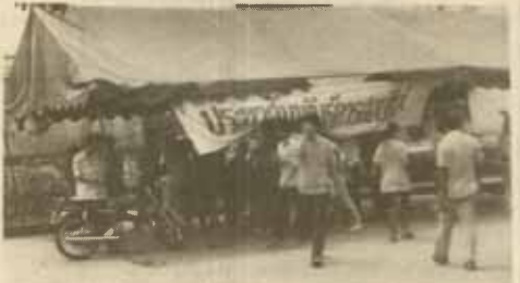
ปชส.สอบไล่ งานประชาสัมพันธ์ ม.ร. จัดตั้งคันทองประชาสัมพันธ์การสอบ บริเวณหน้าเสาธง เพื่อแจกตารางสอบไล่แก่นักศึกษา และให้คำแนะนำแก่นักศึกษาที่มาสอบในการสอบไล่ ภาค 1/2528