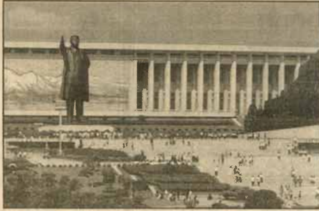
อนุสาวรีย์ประธานาธิบดี คิม อิล ซุง สร้างโดยกบฏริจาคเงินของชาวเกาหลี

คณะของเราเดินทางจากปักกิ่งไปเปียงยางด้วยขบวนรถไฟซึ่งใช้เวลา 1 คืนกับ 1 วัน ก็ได้ใช้บริการของ ร.ฟ.ท. (รถไฟเกาหลี) ไว้เปรียบเทียบกับ ร.ฟ.ท. ของเรา ห้องผู้โดยสารชั้น 1 คล้ายของบ้านเรา แต่เขาอยู่กัน 4 คน คนที่นอนข้างบนจะหวาดเสียวหน่อย พวกเราจับสลากรันว่าใครจะนอนบนหรือนอนล่าง เพราะพวกนอนบนต้องมีไอ โหนราวไว้ด้วย ถ้าใครนอนละเมอมีหัวเหาะลงมาบ้าง ๆ เพราะราวเหล็กที่กันไว้แต่นิดเดียว (อย่างไรก็ตามรุ่งเช้าทุกคนปลอดภัย) ขึ้นรถไฟราว 17.00 น. นั่งชมวิวเมืองปักกิ่งเพลิน ๆ ถึงทุ่งมัจฉกิวเลยชวนกันไปรถเบย์ชางตามธรรมเนียม แต่ก็ต้องออดอ