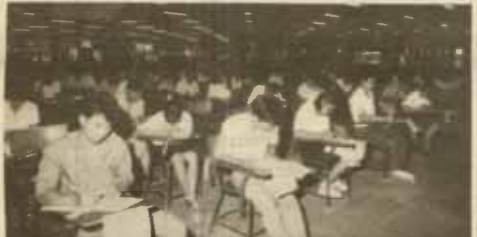
สอบไล่ มหาวิทยาลัยดำเนินการสอบไล่ ภาค 1/2528 ระหว่างวันที่ 7-28 ตุลาคม 2528 ณ รณคันทอง 1 รณคันทอง 2 และโรงเรียนภายนอกอีก 6 แห่ง