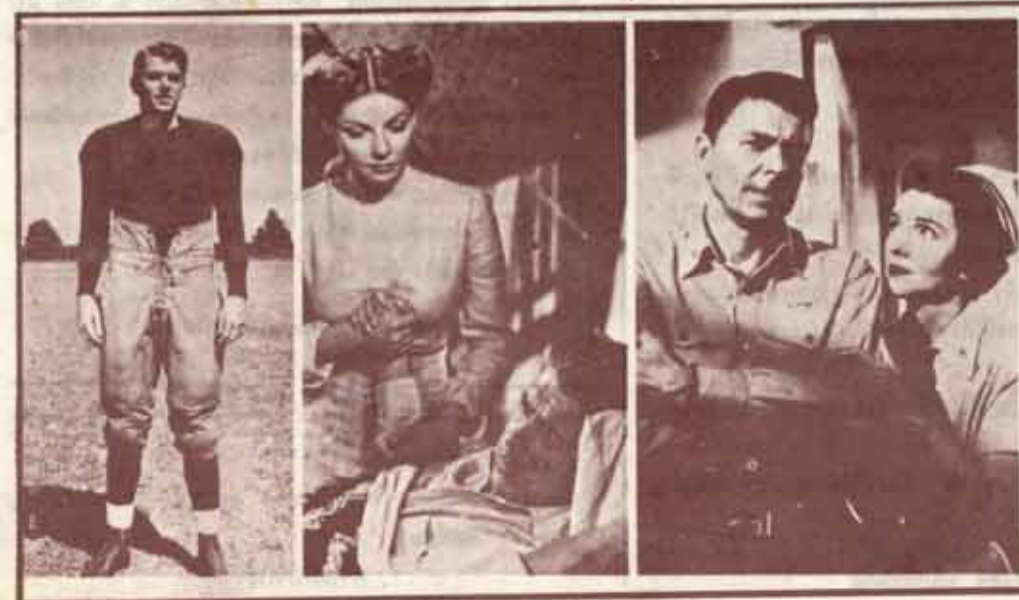
Reagan's film career lasted more than 25 years and included over 50 films. In "Knute Rockne-All American" (far left) he played George Gipp, a legendary football player who died young. He won acclaim for his role in the 1941 movie "King's Row" (center). In "Hellcats of the Navy" (right), in 1956 Reagan costarred with his wife, Nancy.