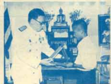
รับโล่รางวัลพระราชทาน