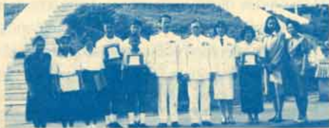
ผู้ชนะการอ่านประกวดร้อยแก้วฯ