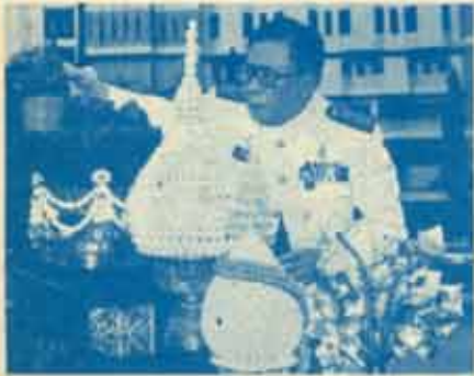
พิธีบวงสรวง