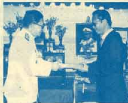
มอบโล่เกียรตินาคณ