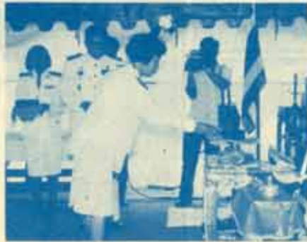
รับเครื่องราชอิสริยาภรณ์