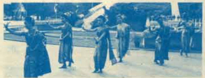
รำถวายพ่อขุนฯ จากชมรมดนตรีไทยฯ