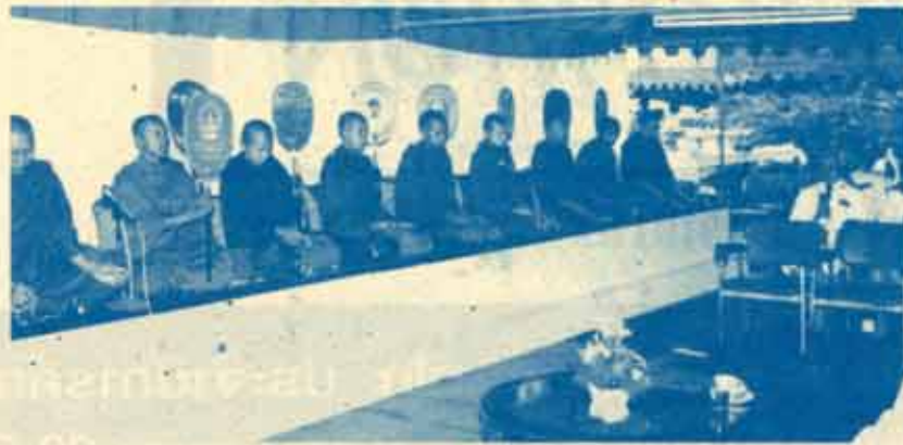
พิธีสงฆ์