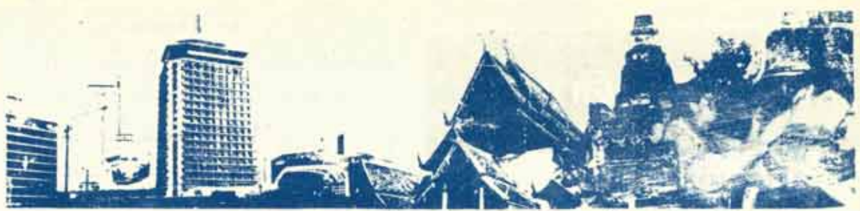
ขอเชิญชาวไร่และนักศึกษาม.ร. ทุกท่านร่วมเขียนบทความสั้น ๆ มาลงคอลัมน์นี้ โดยมีจุดมุ่งหมายส่งเสริมความรู้รอบตัว ทุก ๆ ด้านเกี่ยวกับเมืองไทย ทั้งชีวิตประจำวัน อาชีพ เศรษฐกิจ ประวัติศาสตร์ ภูมิศาสตร์ ฯลฯ ตลอดจนเกร็ดความรู้รอบ ๆ ที่น่าสนใจและเชื่อถือได้