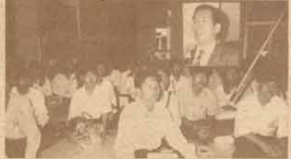
ส.ส.อุบลราชธานี เก้ารามฯ นายอิทธิพล จุฬารัตน สมาชิกสภาผู้แทนราษฎรจังหวัดอุบลราชธานี พรรคประชาธิปไตย ซึ่งเคยดำรงตำแหน่งประธานชมรมปลูกข้าวและได้ว่าที่ อ.ส.ม.ว. ปีการศึกษา 2524 (เมื่อ 13 ปีที่ผ่านมา) ได้กล่าวแนะนำนักศึกษาที่ไปรอเข้าฟังการประชุมสภาผู้แทนราษฎรว่า ระหว่างที่กำลังเป็นนักศึกษาควรทำกิจกรรมบ้างตามสมควร เพื่อจะได้สะสมความเชื่อมั่นในตัวเอง ตลอดจนเสริมสร้างประสบการณ์ในด้านต่าง ๆ ก่อนก้าวเข้าสู่ชีวิตการทำงาน ณ ห้องชมพิพิธภัณฑ์จักรวาลที่ 7 เมื่อวันที่ 27 กรกฎาคม 2537