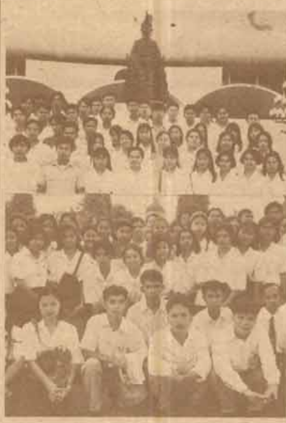
สัมมนาประสมการณใจจริง คณะศึกษามหาวิทยาลัยรามคำแหง จำนวน 110 คน ให้นำเข้าฟังการประชุมอภิปรายถกเถียงเมื่อวันที่ 27, 28 กรกฎาคม 2537 ณ หอประชุมรัฐสภา ก่อนมีพระวรวงศ์เธอ พระองค์เจ้าวิภาวดีรังสิตฯ เสด็จฯ ทรงเปิดการประชุมวิชาการเมื่อวันที่ 30 กรกฎาคม 2537 เป็นต้นไป

และอรอดกาดบับคอมพิวเตอร์สำเร็จแล้วเป็นแห่งแรกในโลก เป็นประโยชน์ต่อการเผยแผ่พระพุทธศาสนา