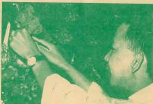
กนตบอดวิบุตถณะของดอกไม้ด้วยการสัมผัส

มีเด็กผู้หญิงคนหนึ่งอายุ 10 ขวบ ตาเริ่มบอดเมื่อตอน 3 ขวบ บอกว่า อยากสร้างภาพผีเสื้อกับดอกไม้สีชมพู บังเอิญในวันนั้นมาตามนาวอนได้ตัดเชือกมัดรูปผีเสื้อไปด้วย จึงได้ถอดให้เด็กคนนั้นสัมผัสดู พร้อมทั้งยื่นกล่องสีให้เธอเลือกสีใช้เอง ผลออกมาเป็นรูปผีเสื้อสีขาวจุดเขียว และมาตามก็ได้ช่วยสอนให้เด็กหญิงผู้นั้นสร้างภาพดอกไม้ต่อ ด้วยความชื่นชมในสิ่งที่เกิดขึ้นต่อหน้าต่อตา ดังกับความฝันกลายเป็นความจริง เมื่อเสร็จแล้วก็ให้เด็กลงชื่อตัวเองกำกับลงบนผลงานของตนเป็นอักษรเบรลล์