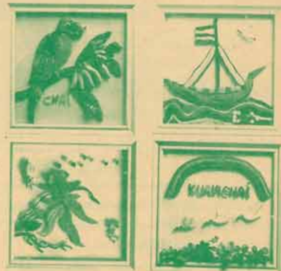
ภาพวาดดินน้ำมันสีที่เกิดจากความรู้สึกนึกคิดและจินตนาการของผู้ตาบอด

ในการแสดงศิลปะภาพวาดสัมผัสมือฯ ครั้งนี้ นอกจากจะเป็นการเผยแพร่ผลงาน และวิธีการสร้างสรรค์ที่กว้างไกล และช่วยให้บุคคลทั่วไปได้เข้าใจถึงความรู้สึกนึกคิด และจินตนาการของผู้ที่ตาบอดได้อย่างลึกซึ้งทั้งผู้ชมทั่วไปโดยการวิจิตร และผู้ที่ตาบอดสามารถรับรู้ได้ด้วยสัมผัสมือแล้ว ยังเป็นการเชื่อมสัมพันธ์มิตรอันดีระหว่างประเทศอิสราเอลกับประเทศไทยอีกด้วย แล้วท่านละ จะไม่ไปชมชื่นชมและให้กำลังใจกับคนกลุ่มนี้บ้างหรือ ?