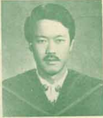
ศาสตราจารย์ ดร. วิมล...