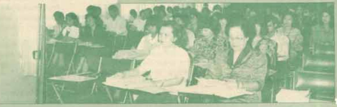
ประชุมทางวิชาการ คณะมนุษยศาสตร์ ม.ร. จัดการประชุมทางวิชาการ เรื่อง "หลักสูตรศิลปศาสตร์-บัณฑิต" ฉบับ พ.ศ. 2532 เมื่อวันที่ 26 มิถุนายน 2532 ณ ห้องประชุมคณะฯ เพื่อชี้แจงรายละเอียดและแนวปฏิบัติเกี่ยวกับหลักสูตรฉบับปรับปรุงใหม่แก่คณาจารย์ เจ้าหน้าที่ และฝ่ายต่าง ๆ ที่เกี่ยวข้อง