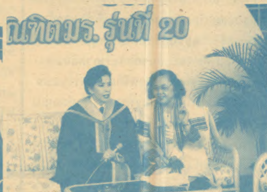
บัณฑิตมร. รุ่นที่ 20