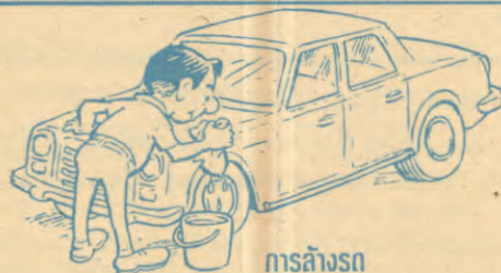
การล้างรถ

น้ำที่จะใช้ควรนำมาใส่ถัง แล้วใช้ผ้าชุบน้ำมาเช็ดถู ซึ่งจะใช้น้ำประมาณ 2 ถัง ไม่ควรใช้สายยางฉีดล้างโดยตรง