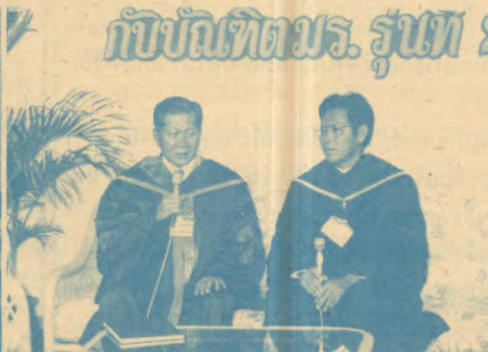
กับบัณฑิตมร. รุ่นที่ ๘