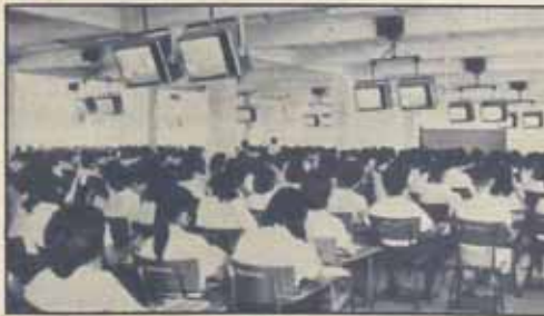
ศักดิ์ ความภูมิใจของศิษย์เก่าและประชากรของมหาวิทยาลัยในวันนี้น่าจะมหาศาลเพียงใด

ถองย้อนกลับมามูลการเรียนการสอนของมหาวิทยาลัยเราดูบ้าง จะพบว่า 14 ปีที่ผ่านมาเราพัฒนาไปค่อนข้างเร็วมาก เมื่อเทียบกับอัตราการพัฒนาของมหาวิทยาลัยทั่วไปทั้งของรัฐและของเอกชน ปัจจุบันมหาวิทยาลัยมีอาจารย์ 708 คน ซึ่งในปี 2514 มีอาจารย์เพียง 152 คน ในจำนวนนี้มีอาจารย์ที่มีวุฒิปริญญาเอก 76 คน ปริญญาโท 495 คน ปริญญาตรี 137 คน เมื่อเทียบอัตราส่วนของอาจารย์ต่อนักศึกษาแล้วตัวเลขที่ได้เป็นตัวเลขที่นักศึกษาที่เชื่อมั่นในทฤษฎีการศึกษาต้องคงเคลือบใจ อัตราส่วนอาจารย์ต่อนักศึกษา (1 : 364) ไม่เพียงแต่ยืนยันว่ามหาวิทยาลัยรามคำแหงได้ทำในสิ่งที่คนส่วนมากคิดว่าเป็นไปไม่ได้ แต่ยังพิสูจน์ให้เห็นถึงประสิทธิภาพของการเรียนการสอนในระบบการศึกษาเปิด และถ้าประเมินในแง่เศรษฐศาสตร์ ค่าใช้จ่ายต่อหัวของบัณฑิตรามคำแหงก็ถูกกว่าทุกสถาบัน จนอาจกล่าวได้ว่าถูกที่สุดในโลกก็ได้ ซึ่งถ้าพิจารณาในด้านมุมมองนี้ อาจทำให้ผู้บริหารการศึกษาของสถาบันอุดมศึกษาหลายแห่งที่ถกเถียงเรื่องระบบเปิดและปิดให้เป็นที่มาของมหาวิทยาลัยรามคำแหงได้ ต้องกลับไปทบทวนและประเมินข้อมูลเรื่อง Cost-Effectiveness กันอีกนาน รัฐบาลเองก็ไม่ควรมองข้ามเรื่องนี้ไปโดยไม่มีพิจารณาข้อมูลของมหาวิทยาลัยเปิด ซึ่งถ้าท่านทำก็จะมิหาคณะที่อื่นที่หันมาคลาสาการศึกษาแบบเปิดขึ้นมาบ้าง