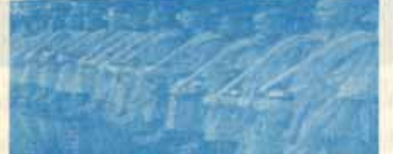
ภาควิชาปรัชญา คณะมนุษยศาสตร์

มาฆบูชา คือการประกอบพิธีบูชาในวันขึ้น ๑๕ ค่ำ เดือน ๓ ตามการนับเดือนของชาวอินเดียโบราณ โดยอาศัยการสังเกตจากการโคจรของพระจันทร์ที่เคลื่อนไปยังดวงดาวต่างๆ เรียกว่า “พระจันทร์เสี้ยวอัญมณี”