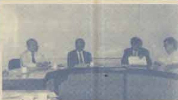
ประชุมสภาอาจารย์ ร.ร.รังสรรค์ แสงสุข อธิการบดีมหาวิทยาลัยรามคำแหง ร่วมการประชุมสภาอาจารย์เพื่อรับฟังข้อคิดเห็นและความต้องการของคณาจารย์ พร้อมทั้งแจ้งนโยบายของผู้บริหารเมื่อวันที่ 18 กรกฎาคม 2537 ณ สำนักงานสภาอาจารย์

สำหรับภาพวาดที่แสดงในงานนิทรรศการที่ ม.ร.นี้ จะนำไปแสดงในประเทศเอเชียตะวันออกเฉียงใต้ต่อไป