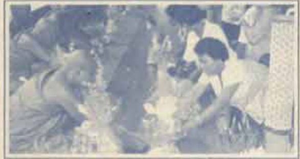
ประชาชนถวายผ้าอาบน้ำฝน และเครื่องไทยทานแด่พระภิกษุสงฆ์ เพื่อใช้ในระหว่างที่จำพรรษา

วันเข้าพรรษา ตรงกับวันแรม 1 ค่ำ เดือน 8 เป็นวันที่พระภิกษุสงฆ์ อธิษฐานว่า จะประจำอยู่ที่ใดที่หนึ่งตลอดระยะเวลา 3 เดือนเต็ม ภายในฤดูฝน โดยไม่เดินทางไปแรมคืนที่อื่น วันเข้าพรรษากำหนดไว้ 2 ระยะ ดังนี้