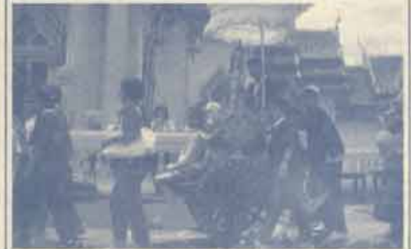
รูปแทนเจ้าเข้าพรรษา ที่ถวายเทียนแด่พระภิกษุสงฆ์เพื่อใช้ในระหว่างที่จำพรรษา

จากการนี้ พระพุทธเจ้าได้ทรงกำหนดให้พระสงฆ์มีการจำพรรษาคงตลอด 3 เดือนในฤดูฝน พุทธศาสนิกชนถือเอาวันแรม 1 ค่ำ เดือน 8 หรือวันเข้าพรรษา เป็นวันสำคัญทางพุทธศาสนา ส่วนในปีนี้ตรงกับวันที่ 23 กรกฎาคม ในโอกาสนี้ขอเชิญชวนพุทธศาสนิกชน เข้าร่วมกิจกรรมตามสะดวก เพื่อเป็นธรรมเนียมและแบบอย่างอันดีงามของเยาวชนของเราทั่วประเทศด้วยเทอญ