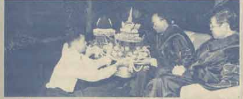
ไหว้ครู มหาวิทยาลัยรามคำแหง ร่วมกับชมรมพุทธศาสตร์และวัฒนธรรมไทย จัดงานไหว้ครู ประจำปีการศึกษา 2537 เมื่อวันที่ 21 กรกฎาคม 2537 ณ หอประชุม เอ.ดี. 1 พร้อมทั้งมีพิธีศีกษาครุ ณ บริเวณลานพ่อบุญฯ

รามคำแหงร่วมฉลองปีวัฒนธรรมไทย จัดนิทรรศการภาพถ่ายโดยจิตรกรจาก 3 ประเทศ ไทย จีน เกาหลี เพื่อเผยแพร่ศิลปไทยด้านภาพเขียนและแลกเปลี่ยนศิลปวัฒนธรรมระหว่างประเทศ โดยแสดงผลงานภาพเขียนกว่า 600 ภาพจากฝีมือของจิตรกร 3 ชาติจำนวน 40 คน ระหว่างวันที่ 1-2 สิงหาคม 2537 ณ ห้องประชุม เอ.ดี.3 (อ่านต่อหน้า 12)