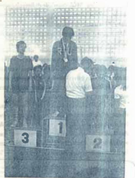
การแข่งขันเชปค-ตะกร้อ กีฬามหาวิทยาลัย ครั้งที่ 5 นัดชิงชนะเลิศ ณ โรงอิม 1 มศ.พลศึกษา เมื่อวันที่ 27 มกราคม 2521 ผลปรากฏว่าทีมเชปค-ตะกร้อของมหาวิทยาลัยรามคำแหง เอาชนะทีมของมหาวิทยาลัยศรีนครินทรวิโรฒ 2 : 1 เครื่องเขียนของ รามคำแหง อาจารย์ปัญญา หิโรจน์