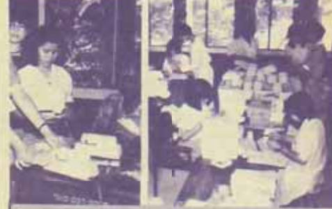
จัดตั้งชม. กองจัดการ "ข้าราชการคนเก่ง" เปลี่ยนแปลงการจัดตั้ง "ข้าราชการคนเก่ง" แก่สมาชิกทางไปรษณีย์ ตั้งแต่ (ฉบับที่ 29) โดยเปลี่ยนจากการใช้ของเป็นข้าราชการส่งเป็นรายเดือนและวันเมื่อที่ส่วนส่งของ "ข้าราชการคนเก่ง" มีมติว่าให้ใช้ของราชการ ซึ่งใช้ทั้งที่ 30 ประจ. สน. น. มีมติว่าให้ใช้ของราชการ และให้ใช้ของราชการเป็น "ข้าราชการคนเก่ง" ต่อมาคือของ

ผู้สมัครขอรับทุนต้องเป็น ข้าราชการ นิสิต นักศึกษา สถาบัน และประชาชนผู้สนใจทั่วไป โดยยื่นใบสมัครขอรับทุนและสอบถามรายละเอียดต่าง ๆ ได้ที่ กองวิจัยและวางแผน สำนักงานวัฒนธรรมแห่งชาติ ในบริเวณสนามกีฬาแห่งชาติ เขตปทุมวัน ถนน 10500 ภายในวันที่ 10 มีนาคม 2529 และจะประกาศผลผู้ที่ได้รับทุนอุดหนุนในวันที่ 30 เมษายน 2529