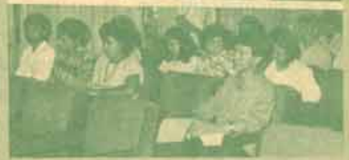
อวยมณี ปรามิขภาคเหนือโดยการศึกษา ม.ร. จัดการ ประชุมเรื่อง "รวมกิจการงานสัปดาห์งานภาคเหนือโดย การศึกษา" เมื่อวันที่ 27-29 พฤษภาคม 2531 ณ ห้องประชุม ชั้น 4 คณะเศรษฐศาสตร์ มหาวิทยาลัยเชียงใหม่

การประชุม ที่ การประชุมงานสัปดาห์งานภาคเหนือโดย การศึกษา เมื่อวันที่ 27-29 พฤษภาคม 2531 ณ ห้องประชุม ชั้น 4 คณะเศรษฐศาสตร์ มหาวิทยาลัยเชียงใหม่