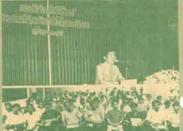
อวยมณี ฝ่ายธุรการ ม.ร. จัดสัมมนา เรื่อง "ภาวะบริหาร สัปดาห์งานภาคเหนือโดยการศึกษา" เมื่อวันที่ 27-29 พฤษภาคม 2531 ณ ห้องประชุม ชั้น 3 คณะนิติศาสตร์ แฉะ จังหวัดระนอง