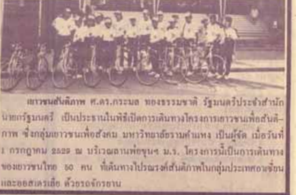
เยาวชนสันติภาพ ศ.ดร.กระมล ทองธรรมชาติ รัฐมนตรีประจำสำนักนายกรัฐมนตรี เป็นประธานในพิธีเปิดการเดินทางโครงการเยาวชนเพื่อสันติภาพ ซึ่งกลุ่มเยาวชนเพื่อสันติภาพ มหาวิทยาลัยรามคำแหง เป็นผู้จัด เมื่อวันที่ 1 กรกฎาคม ๒๕๒๙ ณ บริเวณลานพ่อขุนรามคำแหง โครงการนี้เป็นการเดินทางของเยาวชนไทย ๕๐ คน ที่เดินทางไปรณรงค์สันติภาพในกลุ่มประเทศอาเซียนและออสเตรเลีย ด้วยรถจักรยาน