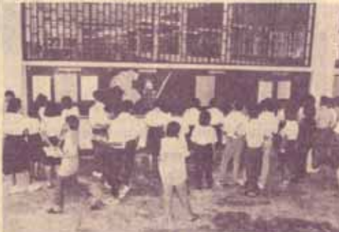
งานกิจการและบริการนักศึกษา รามคำแหง 2 ตั้งอยู่ที่ ตึกศึกษาราม (PRB) ชั้นล่าง โห้วบริการแก่นักศึกษาในเรื่องต่าง ๆ ดังนี้