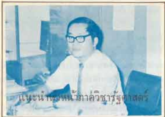
แนะนำหนังสือหน้าปกวิชาวิทยาศาสตร์

● ภาควิชาวิทยาศาสตร์เป็นสาขาวิชาหนึ่ง ที่มี นักศึกษาสนใจกันมาก... ภาควิชาวิทยาศาสตร์เป็นสาขาวิชาที่สำคัญยิ่งใน ภาควิชาศึกษาศาสตร์ของวิชาที่ศึกษาค้นคว้าในคณะศึกษาศาสตร์