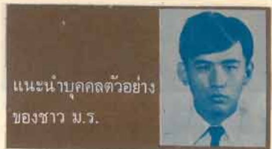
แนะนำบุคคลตัวอย่างของชาว ม.ร.

บางคนจบครูแล้วก็ ไม่อยากที่จะมีอาชีพครู บางทีเขาเหล่านั้นก็อยากจะทำเสียสละทำงานครูเหมือนกัน มิใช่ว่าจะไม่อยากทำงาน ที่เป็นประโยชน์แก่ส่วนรวม เสียสละ