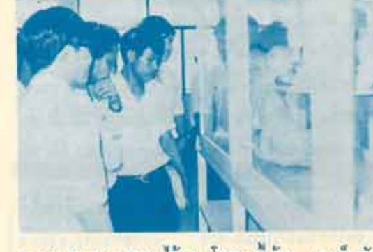
ขอขอบคุณชาว สมม. ไว้ ณ โอกาสนี้ด้วย และก็หวังว่าโอกาสหน้าคุณหมอก็คงจะได้ ไปเยี่ยมเราชาว ม.ร. บ้างเป็นแน่

พวกเราได้รับความรู้ความตื่นเต้น และความสนุก แม้ว่าทุกคนจะเหนื่อยเหนื่อยจากการเดิน ชม เป็นเวลาเกือบห้าชั่วโมงเต็ม ๆ ใน สมม. เราข้ามเรือมาขึ้นที่ท่าพระจันทร์เวลา ๑๘.๓๐ น. และแยกย้ายกันกลับบ้านด้วยความอาลัยยิ่ง