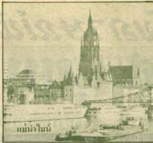
แม่น้ำไรน์