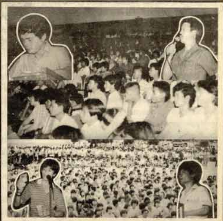
พบนักศึกษา อ.อมร. เชิญผู้บริหารพบนักศึกษา เพื่อตอบข้อสงสัยของนักศึกษาต่าง ๆ เมื่อวันเสาร์ที่ 20 สิงหาคม ณ AD 1