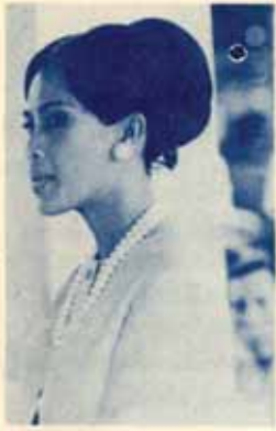
สมเด็จพระนางเจ้าฯ พระบรมราชินีนาถ

ในคอนคำวันที่ ๑๐ มิถุนายน ๒๕๑๔ อธิการบดี ม.ร. ใ้ไปร่วมในงานออกมหาสมาคม ซึ่งรัฐบาลจัดให้มีขึ้น ณ ทำเนียบรัฐบาลเพื่อถวายพระเกียรติแด่พระบาทสมเด็จพระเจ้าอยู่หัวและสมเด็จพระนางเจ้าพระบรมราชินีนาถ เนื่องในวันรัชดาภิเษก