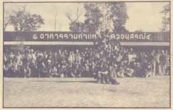
ค่ายอาสา กลุ่มศิลา มหาวิทยาลัยรามคำแหง ออกค่ายอาสาพัฒนา เมื่อวันที่ 5-25 ธันวาคม ที่บ้านมา ณ บ้านโสภณ ต.หนองแดง อ.หนองแดง จ.ขอนแก่น โดยสร้างอาคารเรียนขนาด 9 x 36 เมตร เสาชิง ห้างสุชา โครงการด้านการเกษตร คุวอาสา และสาธารณสุข