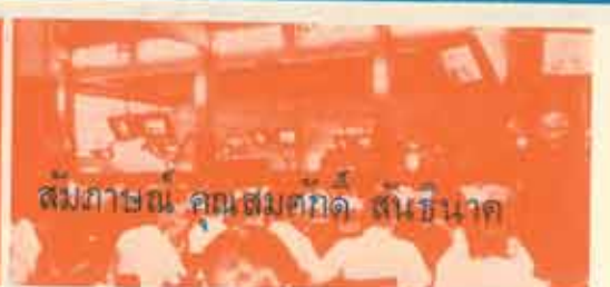
สัมภาษณ์ คุณสมศักดิ์ สันธินาค

มหาวิทยาลัยอรัญญ์ของเราสิ่งใหม่ ๆ หลายอย่าง เมื่อเทียบกับมหาวิทยาลัยอื่นในเมืองไทย เช่น ระบบการศึกษา ระบบการปกครอง มีอยู่สิ่งหนึ่งซึ่งอาจจะถือว่าเป็นของเก่าสำหรับ บางท่านที่เคยพบเห็นหรือใช้มาแล้ว หรืออาจจะเห็นของใหม่ก็ได้ สำหรับคนอื่นจำนวนมากมาย นั่นก็คือระบบโทรทัศน์วงจรปิด (Closed Circuit Television) ซึ่งเป็นอุปกรณ์การสอนสำคัญอย่างยิ่งสำหรับการศึกษาระบบทศวิทยานี้ แต่การจะมีอุปกรณ์อย่างเดี๋ยวนั้นไม่พอ บุคคลสำคัญคุณเครื่องมือเหล่านี้ต่างหากที่จะช่วยให้การทำงานทางด้านอิเล็กทรอนิกส์ ดำเนินไปด้วยดี ชาวอรัญญ์จึงขอแนะนำนักศึกษาให้รู้จักหนึ่งในบรรดาเจ้าหน้าที่ ๔ คน ซึ่งมีหน้าที่รับผิดชอบงานด้านนี้โดยตรง คือ คุณสมศักดิ์ สันธินาค