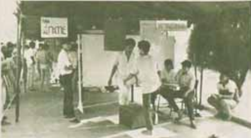
นิทรรศการ ชมรมส่งเสริมสุขภาพและพลานามัย มหาวิทยาลัยรามคำแหง จัดแสดงนิทรรศการ ตรวจเลือก X-RAY ตรวจการโรค (V.D.) และมีการเล่นกีฬาประเภท อิงฮู ดิงปิง ฯลฯ โดยมีการประกวดการแข่งขันทักษะประเภท ขิง ขิวอริกรบคิมมหาวิทยาลัยรามคำแหง ระหว่างนักเพาะกาย ของมหาวิทยาลัยต่าง ๆ คือ เกษตรศาสตร์ ธรรมศาสตร์ และรามคำแหง เมื่อวันที่ 8 - 10 มกราคม 2529 ณ เวทีลาน สวป. และริมสระน้ำใกล้สี่แยกของมหาวิทยาลัย

ก่อนเขยตามความเคยซึ่งครึ่งชีวิต หน้ายสัมพันธ์หรือไรไม่ตอบมา หนึ่งเดือนผ่านท่วงเจ้าเฝ้ารอผล รอข่าวคนบ้านไกลให้ตามหา เจ็บป่วยไข้หรือเปล้าเจ้ากานดา คนคอยทำอีกแดนแสนท่วงนี้ก็ แม้เจ้าหน้ายในมิตรที่คิดถึง หรือยังซึ่งไมตรีที่แน่นหนัก ส่งข่าวบ้างอย่างในใจนงลักษณ์ คนรอจกซึ่งใจไม่รู้กลาย สายลมหนาวพลิวไหวให้สะท้อน อ้อยังบานลือลมชมจันทร์ฉาย ลมคืนถิ่นที่เอนเหมือนปีกกลาย กตัวสุดท้ายเจ้าไม่เยือน... "เหมือนดังลม" ปรัชญา ชื่นสุวรรณ 2760218 0