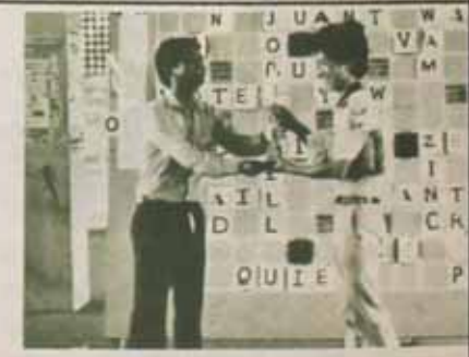
เพนปี ศูนย์บัณฑิตการ ม.ร. ดำเนินการร หมายกรูไทย และสเตรมเบิ้ล จึงอ้ออริกรบคิ วัวันที่ 23 - 27 กรกฎาคม ที่ผ่านมา ณ ชั้นล่างและขี อตาศลาอาสน์ ในภาพ รศ.สุพม นวลสุด อธิ มหาวชิราวุธ รามคำแหง ขอเชิญนักศึกษาและผู้สนใจ ามารวมกัน ณ คึกคัก 18 มกราคม 2529