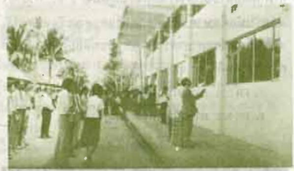
พิธีเปิดอาคารกิจกรรมนักศึกษา

อนึ่ง การสัมมนาครั้งนี้ มีผู้เข้าร่วมสัมมนาจำนวน 252 คน ซึ่งประกอบด้วย ผู้บริหารมหาวิทยาลัย อาจารย์เจ้าของวิชา ผู้อำนวยการศูนย์ และอาจารย์ผู้บรรยายจากศูนย์บรรยายสรุป 12 แห่งทั่วประเทศ และเมื่อเสร็จ