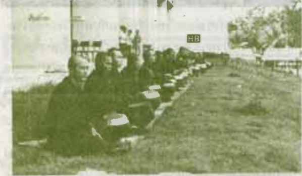
รวมบูชาอาสาฬห' 24