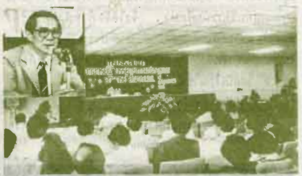
สัมมนาอาจารย์ผู้บรรยายสรุป ตามโครงการอาจารย์สัญญา

ปีที่ 10 ฉบับที่ 12 ปีการศึกษา 2524 18 กรกฎาคม 2524 ราคา 75 สตางค์