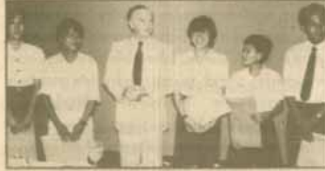
ถ่ายภาพร่วมกับนักศึกษาคณะอื่น ๆ ที่ได้รับรางวัลเกิดเบทส์

รางวัลเกิดเบทส์มี ๒ ประเภท คือ รางวัลนักศึกษาด้าน การเขียน และ รางวัลนักศึกษาคณะ สาขาการเขียน นักศึกษาที่ได้รับการคัดเลือก เป็นนักศึกษาด้านการเขียน จะได้รับรางวัลเป็นเงินสดจำนวน 10,000 บาท และได้รับโอกาสเข้าฝึกงานที่สนใจในบริษัทอีกเป็นเวลา 1 เดือน ส่วนนักศึกษาด้านการเขียนที่ได้รับการคัดเลือกเป็นนักศึกษาคณะ สาขาการเขียน จะได้รับรางวัลเป็นเงินสดจำนวน 15,000 บาท และได้รับสิทธิในการ ไปดูงานในสถานประกอบการในต่างประเทศที่บริษัทกำหนด ทั้งนี้โดย บริษัทจะเป็นผู้ออกค่าใช้จ่ายทั้งหมดให้