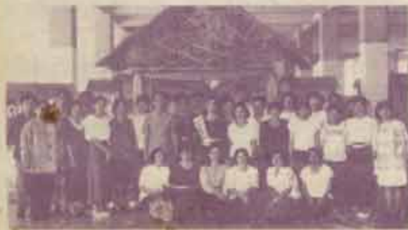
คณะกรรมกรจัดงานร่วมรรมคำแหงด้วยการแต่งกายแบบไทย ๆ

งานกิจการและบริกรรรมคำแหง กองงาน- วิทยาเขตบางนา จัดงานวันรรมคำแหงเพื่อวัฒนธรรม- ไทยระหว่างวันที่ 3-5 สิงหาคม 2537 ณ บริเวณชั้นล่างอาคาร PBE โดยมีกิจกรรมต่าง ๆ อาทิ นิทรรศการ การเดินรรมคำแหงของขบวนนักเรียน การแสดงด้านศิลปวัฒนธรรมไทยประเพณีท้องถิ่น ของนักเรียนภาคต่าง ๆ การสาธิตทำขนมไทย การประกวดคำขวัญ