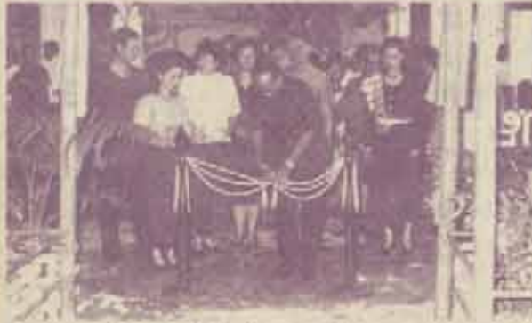
พิธีการบดเป็นประธานเปิดงาน