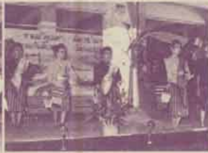
การแสดงศิลปวัฒนธรรมไทยภาคต่าง ๆ