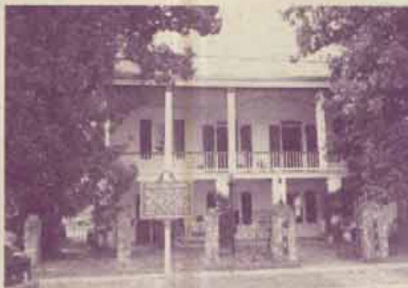
บ้านที่เคท โชนเปง อาศัยอยู่ ปี ค.ศ. 1879-1883 เมืองคลูทิวีลด์

เมื่อธุรกิจของออสการ์ล้มเหลวในปี ค.ศ. 1879 ออสการ์อพยพครอบครัวไปอยู่ที่ไร่ของตระกูลที่เมืองคลูทิวีลด์ ในชุมชน แม่น้ำเคน (Cane River County) ออสการ์ดูแลกิจการไร่ และร้านค้าเล็ก ๆ ในขณะที่เคททำหน้าที่แม่บ้านดูแลครอบครัว ๆ ของเธอครอบครัว