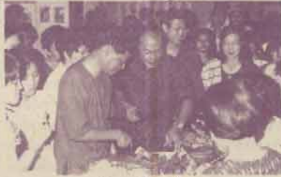
สาธิตการทำขนมไทย