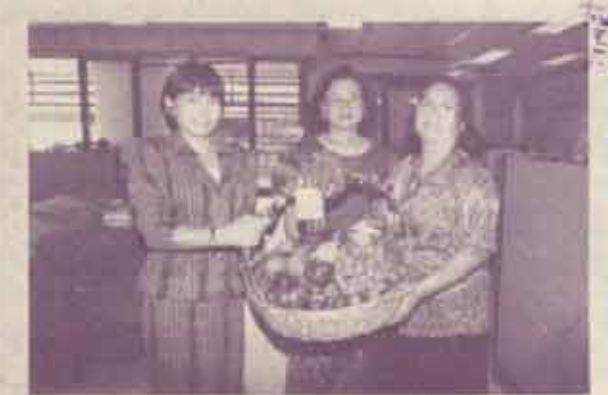
ครบรอบ 48 ปี ศิวแทนมหาวิทยาลัยรรมคำแหง คำแหง มอบกรรรมคำแหงเข้าร่วมแสดงกรรรมคำแหง หนังสือพิมพ์บางกอกโพสต์ ในโอกาสครบรอบ 48 ปี เมื่อวันที่ 1 สิงหาคม 2537

เชิญสมัครเป็นสมาชิกทั้งด้วยตนเองและทางไปรษณีย์ ๑. ชำระเงินที่อาคารเวียงท่า ๒. ดำเนินกรรรมคำแหงที่งานประชาสัมพันธ์ ตึก เอ.ดี. ๑ ชั้น ๒ ๓. ยักรรรมคำแหง รับด้วยตนเองที่ ม.ร. ปีละ ๑๐ บาท รับทางไปรษณีย์ปีละ ๑๕๐ บาท (ดูรายละเอียดจากหน้า ๑๑) (รับสมัครสมาชิกตลอดทั้งปี)