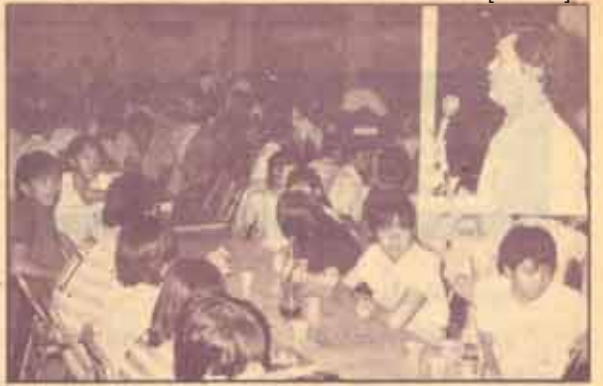
ขอบคุณ กองกิจการนักศึกษา จัดงานเลี้ยงขอบคุณนักศึกษามหาวิทยาลัยรามคำแหง ที่ได้ทำชื่อเสียงเกียรติคุณแก่นมหาวิทยาลัย ในการแข่งขันกีฬามหาวิทยาลัย กีฬามหาวิทยาลัยชายเขื่อน และกีฬาแห่งชาติ ที่ผ่านมา เมื่อวันที่ 22 กุมภาพันธ์ 2528 ณ โรงอาหาร โรงเรียนมัธยมสาธิตรามคำแหง