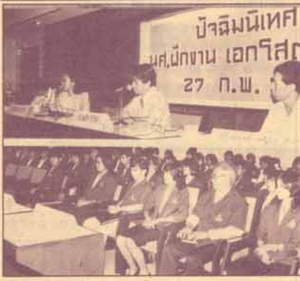
ปัจฉิมนิเทศ ภาควิชาโสตทัศนศึกษา คณะศึกษาศาสตร์ จัดปัจฉิมนิเทศนักศึกษาวิชาเอกโสตทัศนศึกษา โดยเชิดชูบัณ-ชิตรุ่นพี่มาสนทนาเกี่ยวกับประสบการณ์ในการทำงานและการศึกษาต่อ เมื่อวันที่ 27 กุมภาพันธ์ 2528 ณห้องประชุม คณะศึกษาศาสตร์ ชั้น ๘