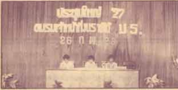
ประชุมชมรมฯ ได้ ชมรมเจ้าหน้าที่งบรายได้มหาวิทยาลัยรามคำแหง(ช.ร.บ.ร.)จัดประชุมใหญ่ประจำปี เพื่อรายงานกิจการของชมรมฯในรอบปีที่ผ่านมา เมื่อวันที่ 26 กุมภาพันธ์ 2528 ณ ห้องประชุม เอล.1