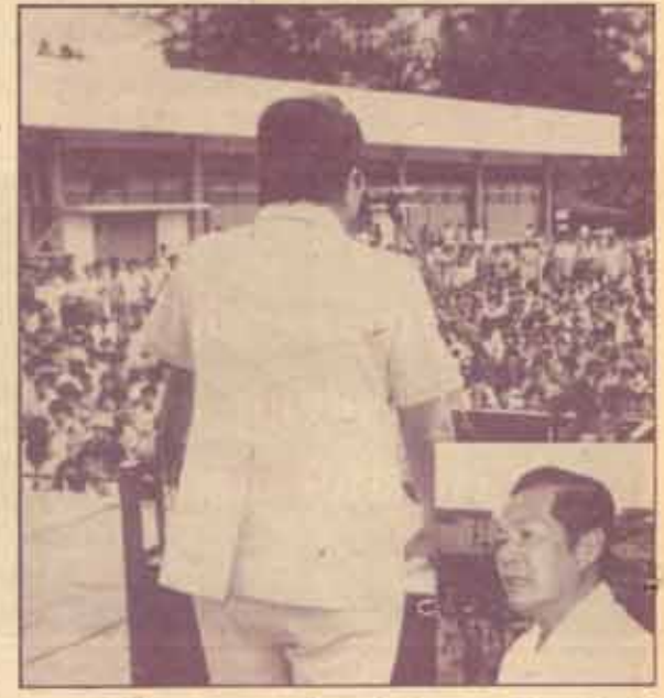
อภิปรายนอกสภา องค์การนักศึกษามหาวิทยาลัยรามคำแหง จัดอภิปรายนอกสภาเมื่อวันที่ 25 กุมภาพันธ์ 2528 ณ เวทีลานสวน. โดยมี พลตรีประมาธ อดิเรกสาร หัวหน้าพรรคชาติไทย นายปิยะฉัตร วิชารภรณ์ รองประธานสภาผู้แทนราษฎรคนที่ 2 และ ผ.ส.จากพรรคชาติไทยอีกหลายคนเป็นผู้บรรยาย