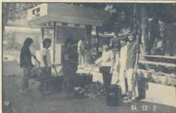
พัฒนา คณะบริหารธุรกิจ ม.ร. ร่วมกับนักศึกษาช่วยกัน ทำความสะอาดบริเวณรอบอาคารศรีวิชัยพาณิชย์ เนื่องในวโรกาสวันเฉลิมพระชนมพรรษา เมื่อวันที่ 5 ธันวาคม ที่ผ่านมา