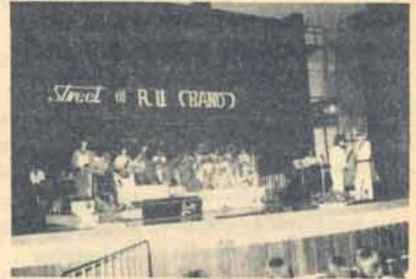
คอนเสิร์ต วงดนตรีสากลของ ม.ร. (วง RU Band) จัดแสดง คอนเสิร์ต สำหรับนักศึกษาและชาวรามคำแหง เมื่อวันที่ 19 ธันวาคม 2527 ณ ห้องประชุม เอ.ดี. 1