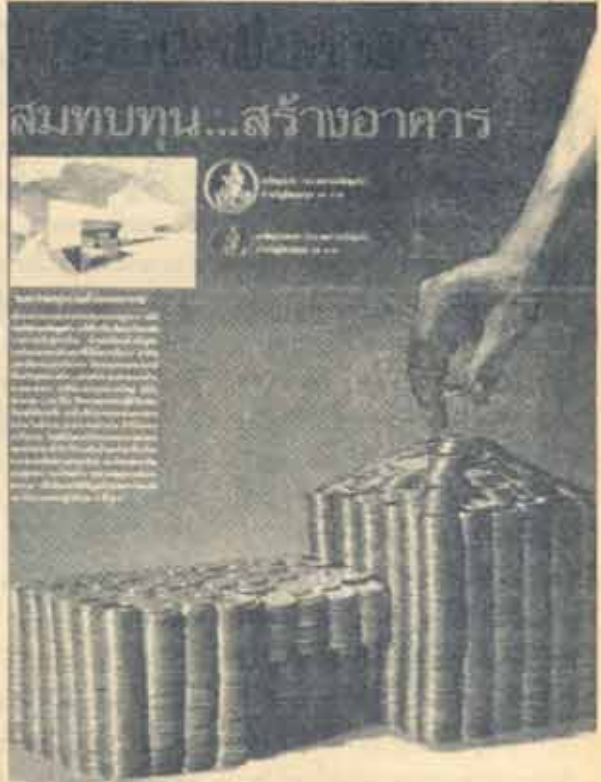
ผู้มีจิตศรัทธาช่วยกันบริจาคเงินเพื่อ โครงการ สืบค้นงานเอกสารเก่า ม.ร.โดยชมรมเอกสาร เก่าทางภาคใต้ สภ.อ.วังทอง