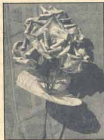
ช่วยสายใจไทย ช่อดอกไม้ประดิษฐ์ด้วยดอกไม้ ซึ่งคณะกรรมการประชาสัมพันธ์ ทูลเกล้าฯ ถวายแด่สมเด็จพระเทพรัตนราชสุดาฯ เพื่อโดยเสด็จพระราชกุศลสมทบทุนมูลนิธิสายใจไทย