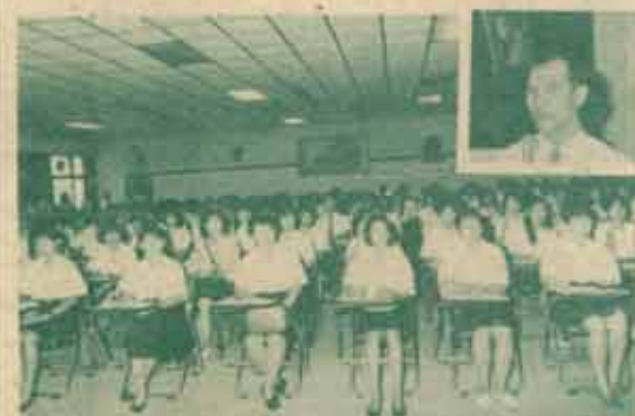
ปฐมนิเทศพนักงานใหม่ งานแนะแนวและทุนการศึกษา กองกิจการนักศึกษา ร่วมกับบริษัทสยามจีไอ จำกัด จัดการปฐมนิเทศและฝึกอบรมแก่บัณฑิตและบัณฑิตของมหาวิทยาลัยรามคำแหงที่ผ่านการสอบข้อเขียนและสัมภาษณ์เข้าทำงานในบริษัท ๖ เมื่อวันที่ 12-13 มกราคม 2534 ณ ห้องประชุมประมวล กุศลศักดิ์