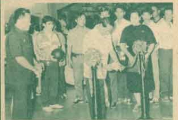
ในวันอังคารที่ ๑๒ มกราคม ๒๕๓๔ ณ ศาลากลางจังหวัดบุรีรัมย์

สินค้าที่เรารผลิต ควรคำนึงอยู่เสมอว่าต้องมีคุณภาพได้มาตรฐาน และมีการพัฒนาอยู่เสมอ เมื่อเป็นที่ยอมรับของผู้บริโภค หรือนานาประเทศแล้วจะบังเกิดผลต่อตัวเราเองและประเทศชาติ ตลอดจนสามารถต่อสู้กับคู่แข่งจากนานาประเทศได้และอีกอย่างที่เราไม่ควรมองข้ามคือ เขาชวนเพราะเขาชวนเปรียบเสมือนแสงอาทิตย์ ที่ทิ้งไม่ลงพื้นยอดเขาเปรียบเสมือนอาทิตย์ กำลังอุทัยขึ้นมาแล้วจะต้องแผ่ประกายต่อไป กล่าวได้ว่าเขาชวนเป็นกำลังสำคัญของชาติในอนาคต เราควรช่วยกันเสริมสร้างอุปนิสัยให้เป็นผู้ที่มีความรับผิดชอบในสิ่งที่ตนทำหรือผลิตขึ้นมาด้วยความตั้งใจแน่วแน่ที่จะทำอะไรก็ตามไม่ว่าสิ่งเล็กสิ่งน้อยให้มีคุณภาพได้มาตรฐาน และมีการปรับปรุงพัฒนาวิธีการหรือการกระทำของตนให้ดีขึ้นกว่าเดิมอยู่เสมอ เมื่อทำได้เช่นนี้จะมีคำว่า “มีคุณภาพ ได้มาตรฐาน มีการพัฒนา” คอยติดตามตักเตือนเขาชวนของเราตลอดไป เมื่อถึงวันนั้น ผลผลิตหรือสินค้าของคนไทยก็จะเป็นที่ยอมรับของคนไทยทั่วไปไม่ว่าในประเทศหรือนานาประเทศ และในไม่ช้าเศรษฐกิจของประเทศ ก็จะก้าวไกลได้เท่าทันกับนานาประเทศได้เช่นกัน