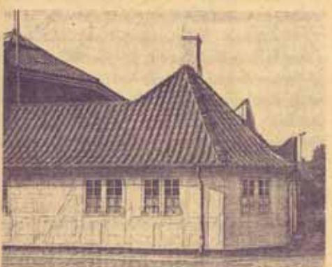
บ้านเกิดของ Hans Christian Andersen

เด็กน้อยเกิดจากจินตนาการในนิทานเรื่อง Den Lille Havfrue ของนักเขียนเทพนิยายอันเลื่องชื่อของเดนมาร์ก ที่ชื่อว่า อันส์คริสเตียนแอนเดอร์สัน (Hans Christian Andersen) เขาเกิดเมื่อวันที่ 2 เมษายน ค.ศ.1805 ที่เมือง Odense บนเกาะ Funen หรือ Fyn ในภาษาเดนมาร์ก เมื่ออายุได้ 10 ขวบบิดาของเขาถึงแก่กรรมลงทำให้เขาอยู่กับมารดาซึ่งมีอาชีพรับจ้างซักผ้า แอนเดอร์สันเป็นคนมีจุกบว หนัการะตุก รูปร่างมอม สูงแก้ง่างและเก๋ไก๋ อันบุคลิกของเขาเป็นที่ล้อเลียนแก่ผู้พบเห็นเสมอ เขาพยายามอ่อนน้อมมารดาเพื่อขออนุญาตให้เขาเดินทางไปยังเมืองหลวง มารดาของเขาเชื่อในหมอดูที่ทำนายว่าบุตรชายของนางจะเป็นผู้มีชื่อเสียงของโลก และนำเอาเกียรติยศมาสู่บ้านเกิด