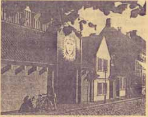
ทางเข้าพิพิธภัณฑสถานแห่งชาติ หอสมุด

แอนเดอร์สันเดินทางท่องเที่ยวไปหลายประเทศในยุโรปและได้เดินทางไปประเทศอิตาลี ที่ซึ่งเขาได้เขียนหนังสือชื่อ The Improvisor อันเป็นหนังสือที่ขายดีในยุโรป มีการแปลเป็นภาษาต่าง ๆ ถึง 8 ภาษาในเดือนพฤษภาคม ค.ศ.1837 หนังสือเทพนิยายเล่มแรกของเขาได้ถูกจัดพิมพ์ขึ้น หนังสือเล่มนี้ประกอบด้วย 4 เรื่อง คือ The Tinderbox Little Claus and Big Claus, Little Ida's Followers, The Princess and the Pea แอนเดอร์สันมีผลงานด้านเทพนิยายรวมทั้งสิ้นถึง 156 เรื่อง วิธีการเขียนบางเรื่องก็เขียนแบบเล่านิทานให้เด็กฟัง นิทานของเขาที่เป็นที่รู้จักดี เช่น Nightingale, Little Mermaid, The Emperor's New Clothes, the Snow Queen และ The Ugly Duckling เป็นเรื่องของเขาถูกเปิดขึ้นเพื่อชมตามเนื้อเรื่องคล้ายตัวเขาที่มีรูปร่างหน้าตาไม่งดงาม แอนเดอร์สันถึงแก่กรรมเมื่อวันที่ 4 สิงหาคม ค.ศ. 1875