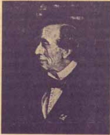
รูปของ Hans Christian Andersen จากฝีมือการวาดของ Carl Bloch ในปี 1869