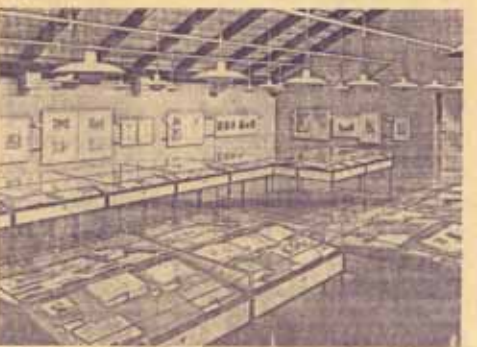
ห้องสมุด Hans Christian Andersen

พิพิธภัณฑสถานและห้องสมุดอันส์คริสเตียนแอนเดอร์สันเปิดให้ประชาชนทั่วไปเข้าชมได้ตลอดปี โดยในฤดูหนาว (ตุลาคม-มีนาคม) เปิดตั้งแต่เวลา 10.00-15.00 น. ส่วนในฤดูอื่น ๆ เปิดถึง 18.00 น.