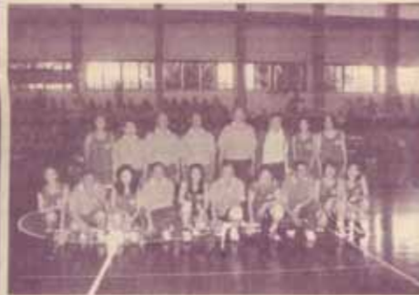
บาสเกตบอลคู่พิเศษระหว่างทีมผู้บริหารและทีมรวมคารา