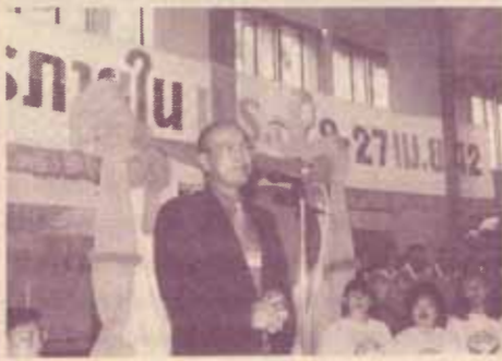
อธิการบดีกล่าวเปิดงาน