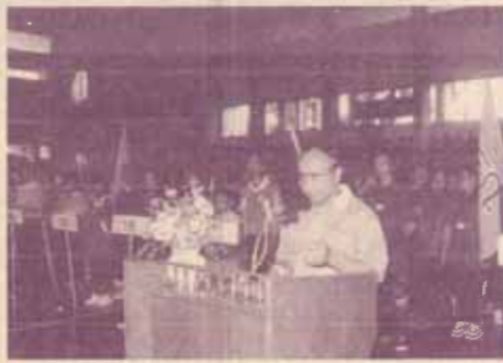
ผู้อำนวยการสำนักกีฬากล่าวรายงาน