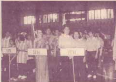
ขบวนพาเหรดของหน่วยงานต่าง ๆ