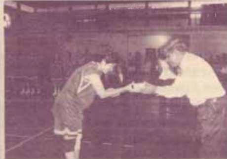
รองอธิการบดีประจำสำนักงานอธิการบดีมอบของที่ระลึกแก่ทีมรวมคารา