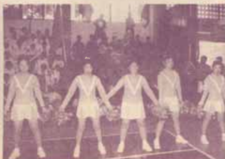
ลีลาของเชียร์ที่เข้าร่วมประกวดกองเชียร์