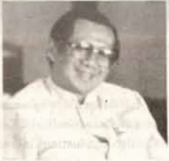
รศ.ดร.อภิรรมย์ ณ นคร อธิการบดี

“ปีนี้คนกรุงเทพฯและชาวรามคำแหงพร้อมที่จะรับการ ภาณ์น้ำท่วมมากกว่าปีกลายหลายเท่า เพราะได้เตรียมการ ป้องกันและดำเนินการป้องกันไปแล้ว ฉะนั้นหากน้ำที่จะท่วม ในปีนี้มีปริมาณเท่ากับปีกลายแล้ว ความเสียหายที่จะเกิดขึ้น กับกรุงเทพฯ หรือเกิดขึ้นกับรามคำแหงก็จะน้อยกว่าปีกลาย อย่างแน่นอนครับ อันนี้เป็นคำยืนยันจากผู้ว่า กทม. ซึ่งผมได้ มีโอกาส ไปพบด้วยตนเองนะครับ”