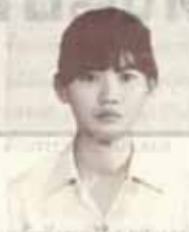
น.ส. รุ่งจิตต์ พรวลวัฒน์ รองนายกฯ คนที่สอง